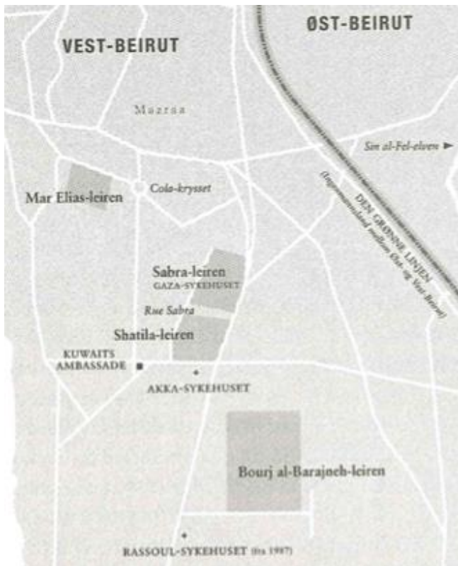
Billede 3: Kort over Sabra og Shatila der ligger lige ved siden af hinanden. Nord for lejren ligger Fakhani Republic, hvor PLO havde sine kontorer. Copyright: Erik Fosse, Med livet i hendene. Stemmer fra Krigssonen . Oslo: Gyldendal, 2013. 91.

fuldstændig efter 1982. Denne kollaps faldt sammen med en splittelse indad i PLO, som også havde en dyb indvirkning i livet i flygtningelejrene. En anden rystende begivenhed fandt sted bare to uger efter PLO's tilbagetrækning og udelukkelse af Libanon, nemlig Sabra og Shatila massakren. 120 Under påskud af at den nyvalgte libanesiske præsident Bashir Gemayel blev dræbt i et bombeangreb i falangisternes hovedkvarter i øst-Beirut i september 1982, krævede falangisterne hævn. Israelsi Defence Force (IDF) gik ind i vest Beirut, og etablerede sig rundt om Sabra og Shatila hvor de havde næsten fuldt indsyn til lejren og mulighed for at snigskytte. 121 Med hjælp fra IDF gik den libanesiske højreorienterede maronittiske milits, Lebanese Forces, ind i