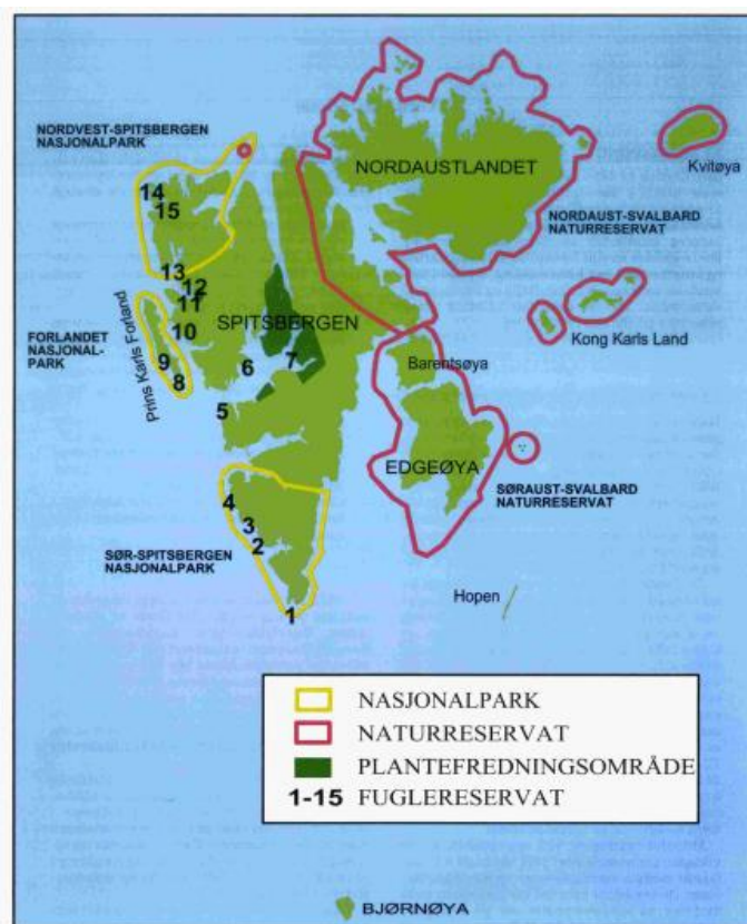
Kart over de vernede områdene på Svalbard

komme til. Naturreservatene var områder med noen av verdens mest sjeldne arktiske økosystemer, og hovedformålet var å bevare de spesielle dyre- og planteartene som befant seg der. De østlige reservatområdene var et viktig tilholdssted for villreinen, og isbjørnens reproduksjonsområde og oppholdssted, Kong Karls land, lå der. Tusenøyene og Halvmåneøyene helt ytterst i det sør-østlige reservatområdet var basen til den sjeldne ringgås og hvalrossen. I de vestlige kystområdene ble det opprettet fuglereservater siden det var oppholds- og rugesteder for et stort antall sjøfugl. Det var antageligvis en av de største konsentrasjonene i verden av arter som lomvi, alkekonge, teist og kyrkje, og det var viktige hekkeområder for ærfugl og gjess. For å ikke forstyrre fuglelivet, ble det innført totalt ferdselsforbud der i rugetiden. Sammen med fuglene som holdt til i fjellene langs kysten i de østlige områdene av Svalbard, talte sjøfuglbestanden på øygruppen flere millioner fugl. Siden det var liten hensikt å frede landområder om man ikke hadde kontroll på skadelige aktiviteter i havet og sjøbunnen utenfor, omfattet fredningen også sjøen rundt landområdene. For fuglereservatene strakk fredningen seg 300 meter ut i havet, mens de andre områdene dekket kystfarvannet ut til territorialgrensen. Kystområdene, øyene og havet til sammen utgjorde integrerte økologiske enheter, og havet hadde stor betydning for livet på land og i luften. 165