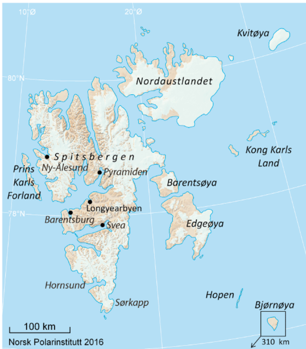
Kart over Svalbard.

Illustrasjon i Prop. 1 S (2017 – 2018). For budsjettåret 2018 – Svalbardbudsjettet. Justis- og beredskapsdepartementet, s. 54.