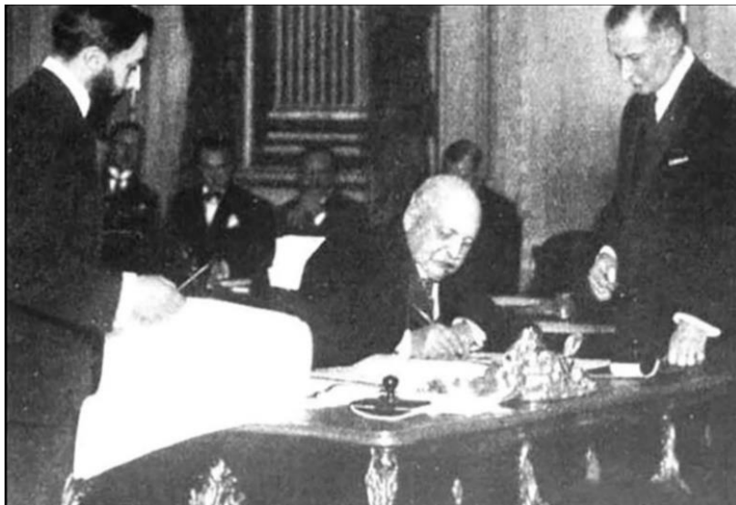
Fritz Wedel Jarlsberg signerer Svalbardtraktaten på vegne av Norge i Paris, 9. februar 1920. 20

Det som er interessant med Svalbardtraktaten er at selv om den stadfester Norges suverenitet over øygruppen, er det spor av «allmenning»-tankegangen som er blitt beskrevet, ved at alle nasjoner som ratifiserer avtalen skal ha lik rett til å oppholde seg og bruke øygruppen, så lenge man retter seg etter de lover og regler som gjelder. Det var ni land som opprinnelig skrev under på Svalbardtraktaten og hadde rett til å bruke øygruppen på traktatens vilkår, men det var åpent for at andre nasjoner kunne slutte seg til traktaten senere. Derfor er det i dag over 40 land som har sluttet seg til avtalen. 19