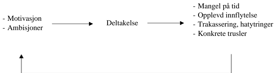
Figur 2: Modell av politisk frafall

Dette kapittelet har forsøkt å aktualisere temaet og problematikken ytterligere, og å redegjøre for følgene frafall blant unge folkevalgte kan ha. Både gjennom dets implikasjon på det representative demokratiet og hvordan frafall henger sammen med videre rekruttering og valgoppslutning. Oppgaven har videre presentert hvordan teoretiske bidrag og tidligere forskning setter grunnlag for antakelsene.