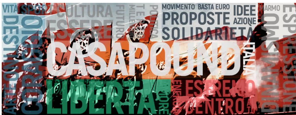
Fig. 6: Ett av tre forsidebilder på www.casapounditalia.org . 197

Gjennom denne collagen kan en interessert leser med en gang bli trukket inn i den politiske dimensjonen til CasaPound; alt leseren trenger å gjøre er å studere kunsten nøye for å få ut de politiske synspunktene. Mange av sakene i collagen har også sammenheng med futuristenes viktige saker; ord som kunst, kultur, mot, energi, fremtid og dynamikk fremkaller alle futuristenes retorikk og ideer. Disse konseptene gir en tydelig gjenklang til futuristenes egne manifeste, og understreker en kontinuitet fra bevegelsen til CasaPound. CasaPound fremmer også mer «tradisjonelle» CasaPound-saker i denne plakaten som solidaritet, kritikk mot euroen og «estremo centro alto», deres begrep for transcenderingen av høyre-venstre-aksen.