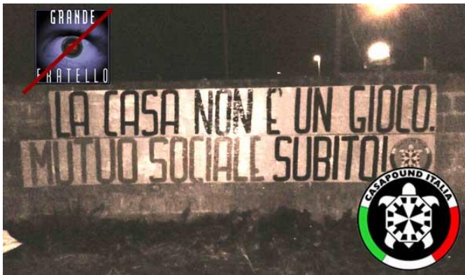
Fig. 11 - «Huset er ikke et spill - Mutuo Sociale straks!» 204

Liknende aksjoner er blitt gjort andre steder i Italia, med liknende plakater. Denne provoserende aksjonen er ment å illustrere den akutte situasjonen med u håndterlige boliglån og økonomisk usikkerhet i Italia, noe CasaPound ser i sammenheng med selvmordstallene i Italia. Siden de slik mener at banker og staten kan ta liv, vil de vise de dystre sidene ved saken. Denne demonstrative aksjonen er likevel også en del av deres aktive strategi for å oppnå så mye PR som mulig, i bevegelsens tidligere nevnte strategi squadrismo mediatico .