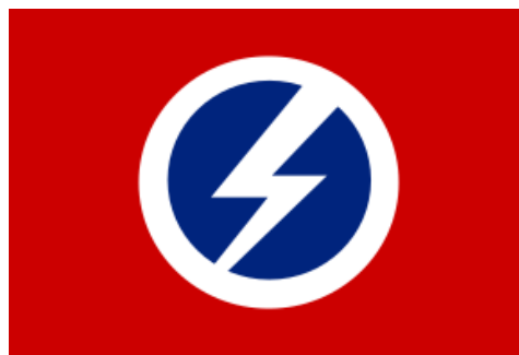
Fig. 4: Logo British Union of Fascists . 174