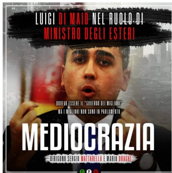
Fig. 7: «Luigi di Maio i rollen som utenriksminister. Det måtte være i «de bestes regjering», men de beste er ikke i parlamentet. #Middelmådighet. Sergio Mattarella (Den italienske presidenten) og Mario Draghi (Den italienske statsministeren) styrer. 199

CasaPound har ved flere sammenhenger hatt kampanjer som retter seg mot politikerne som sitter ved makten i Italia. Vi har allerede nevnt Blocco Studentescos protester mot Monti-regjeringen, der ungdomsgruppen fremstilte Mario Monti som en vampyr. Andre eksempler finner vi i en av CasaPounds pågående mediekampanjer. Oppdatert etter mai 2021 publiserer CasaPound ekstensivt en pågående kampanje ved navn #mediocrazia på chattetjenesten Telegram, og de har også drevet denne kampanjen på Twitter. I bildet under ser vi et eksempel, med utenriksminister Luigi di Maio i bildet.