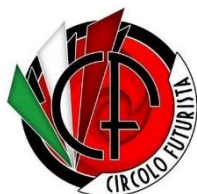
Fig. 5 - Logoen til Circolo Futurista 188

En annen viktig undergruppering som understreker kontinuiteten fra futurismen til CasaPound er Circolo Futurista . 189 Disse markerer seg spesielt med sine direkte referanser til futuristene i sine arrangementer, og sitt ønske om å få futuristenes tanker frem på dagsorden. I sin promotering av det futuristiske tankesettet har de organisert aktiviteter, kunstutstillinger og demonstrasjoner. Som en av CasaPounds undergrupperinger har de også hatt et sterkt fokus på å videreføre futuristenes utsagn i en moderne politisk diskurs. De kombinerer en politisk promotering for CasaPound med ulike utsagn fra futuristene i form av manifeste, kunst og andre kulturelle bidrag. Nettsiden deres informerer dermed forsøksvis om futurismen i CasaPounds syn.