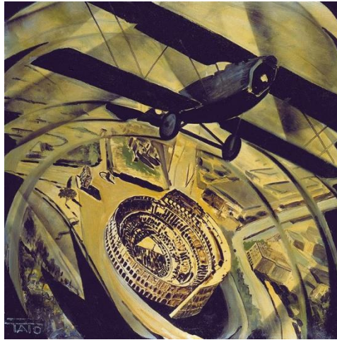
Fig. 20: Toto, Spiraling over the Colosseum , 1930 226

teknologiens kraft og muligheten for et samfunn til å bli endret radikalt, vise Italias kraft ved å legge deres nasjonale symboler til i bildet: