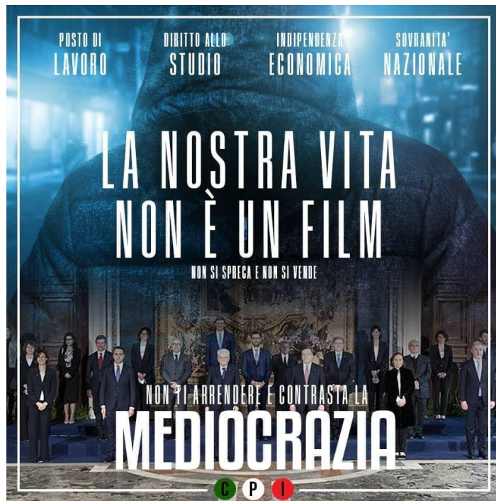
Fig. 8: «Vårt liv er ikke en film - det er ikke bortkastet og det selges ikke». Undertekst: «Ikke gi opp og kjemp mot #middelmådighet!» 201