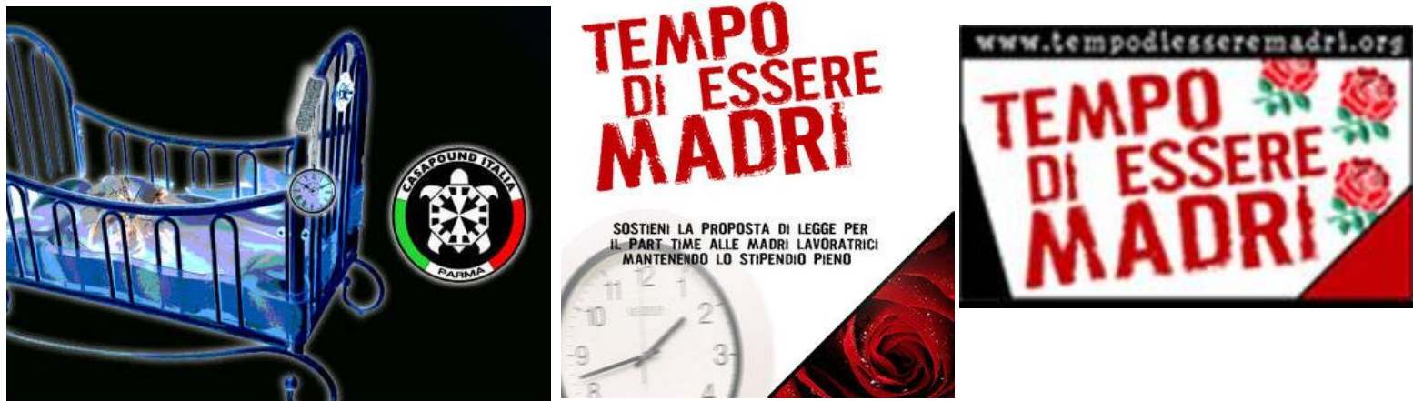
Fig. 12: Fremstilling av forslaget ved en barneseng og en tikkende klokke. 205