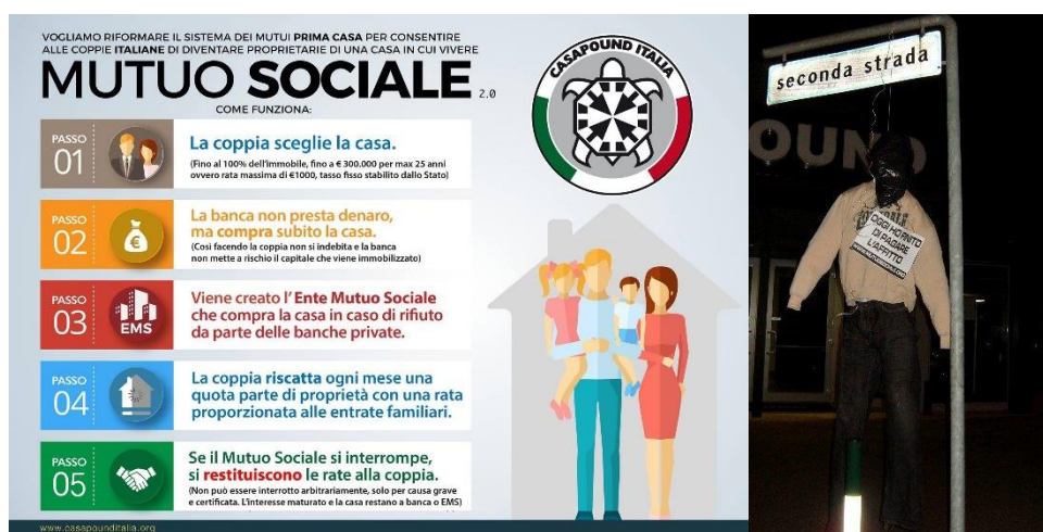
Fig. 9. En konvensjonell informasjonsplakat som forklarer CasaPounds forslag. 202

Innledningsvis kan vi se på mutuo sociale , CasaPounds forslag til et boliglån som er ment å garantere at alle har muligheten til kjøpe et hjem. I profileringen av denne saken, finnes det to vidt forskjellige eksempler, der det ene er hentet fra partiets nettside, og det andre er hentet fra en demonstrasjon mot høye boligpriser.