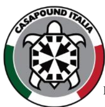
Fig. 1. CasaPounds offisielle logo. 3

Bevegelsen CasaPound ble stiftet i 2003 i det multikulturelle distriktet Esquilino i Roma. 4 Navnet CasaPound er satt sammen av ordene Casa, det italienske ordet for hus, og Pound, som viser til den amerikanske poeten Ezra Pound. Poeten var kjent for sin sterke kritikk av finansmiljøene, og under andre verdenskrig støttet han og propaganderte for Mussolini-regjeringen, noe CasaPound har fremhevet som positivt på sin egen nettside. 5 CasaPound profilerte seg tidlig i Italia med sin ukonvensjonelle holdning til politikk. Denne holdningen var todelt. På den ene siden utfordret CasaPound tradisjonelle og etablerte tanker i det høyreorienterte landskapet ved å adoptere flere venstreorienterte standpunkter og symboler i sin politiske promotering. 6 På den andre siden ønsket de å promotere det sosiale fellesskapet i bevegelsen sin gjennom kulturelle aktiviteter, der aktivitetene iboende i seg igjen var preget av deres politiske standpunkter. Disse aktivitetene omfattet blant annet festivaler, konserter og møter på deres lokale stampub Cutty Sark i Roma. CasaPound markerer seg fremdeles aktivt i det italienske politiske bildet, først og fremst gjennom provokative demonstrasjoner og