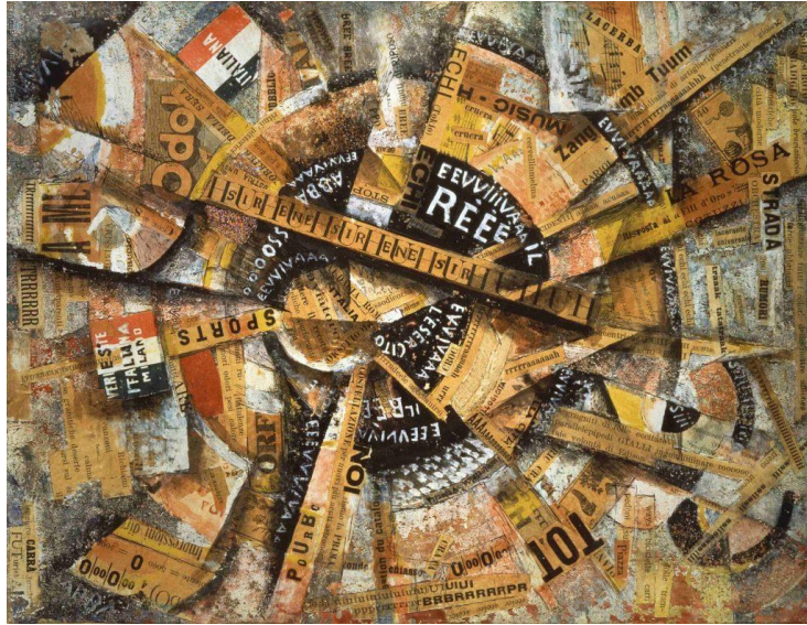
Fig. 19: Carlo Carrà, Interventionist demonstration (1914) 223