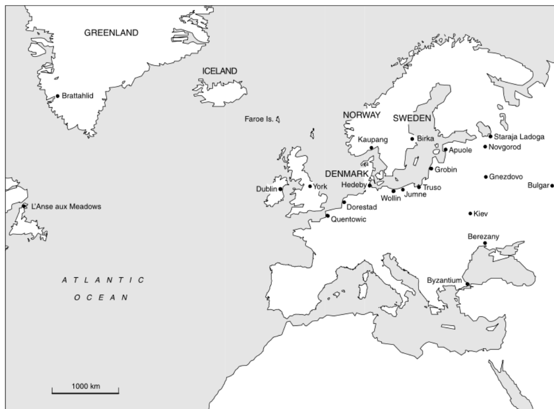
Illustrasjon 4. 90

Dette underbygger den tidligere påstanden om at handelen ble mer sentral i det skandinaviske samfunnet, men det kan også si noe om endring av høvdingens makt. Alt foregår nødvendigvis ikke hos han når det er byen som er sentra og ikke han selv. På en måte er det mulig å si at bydannelse førte til en slags utzooming i de skandinaviske forhold i dette at man med byene og langdistanse til en større grad søkte utover. Hva dette konkret skyldes kan være vanskelig å si noe om, det kan f.eks. være etterligning av de europeiske tendensene, samtidig som at plasseringen av de første skandinaviske byene var veldig gode rent praktisk sett. Den samme tendensen til plassering finner vi f.eks. i Rus' der man kan finne bydannelser ved elver som ble brukt som handelsveier til f.eks. Bysants. 91