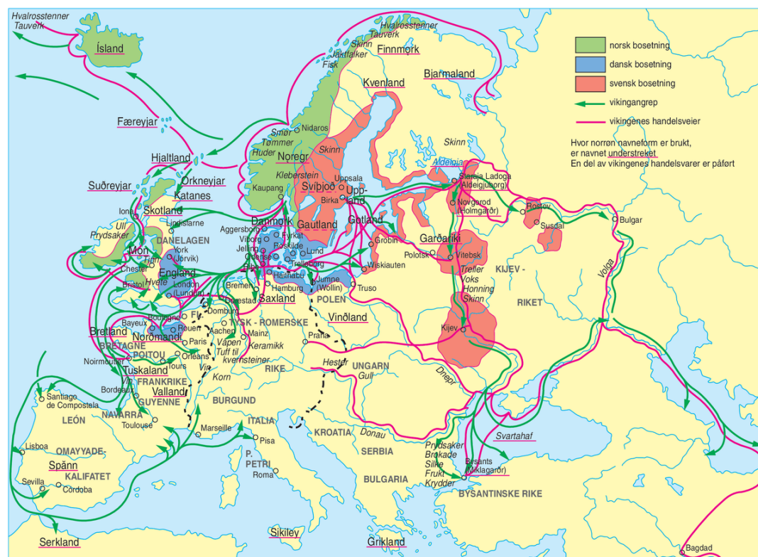
Illustrasjon 2. 85

denne forskjellen at slaverne holdt igjen sølv væringene skulle ha hatt da de, gjennom Vladimir I styring, på dette tidspunktet hadde et formål om å sentrere makt i Kiev. 83 Alt i alt er det mulig å si at edelmetall ga makt, noe man også forstod i samtiden. På denne måten kan også handelen, der man fikk inn edelmetall i tillegg til unike varer, bidro til å styrke enkelte høvdingers makt til at de etter hvert kunne kalle seg kristne konger. Det er flere forfattere som skriver om edelmetall som sølv og forflyttingen av denne som en del av handelen Skandinavia var en del av. 84 Annerledes sett kan man også si at edelmetall og verdier var et stridsegg fordi det var den mest åpenbare veien til makt og å opprettholde den. Når det kommer til det økonomiske aspekt betyr geografisk inndeling i ulike områder at man opererer med ulike områder innenfor handel, at det er mulig å konkretisere tilgjengelige ressurser i et område og at man dermed får mulighet til å betegne en i forskjell på hvilke områder som er økonomisk sterkest og kan derav være viktige å ha kontroll over.