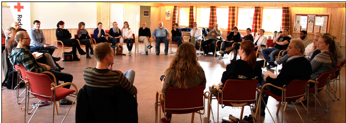
Eksempel på stormøteoppsett 322

Stormøter blir konsekvent gjennomført i form av sirkel av stoler uten bord (bildet under). I konfliktrådets opplæring hadde vi lært hvordan man som tilrettelegger lager et sittekart for partene i sirkelen. Sittekartet inkluderer hvilken rekkefølge tilretteleggerne spør de ulike partene, annenhver gang. Konfliktrådet bruker konsekvent to tilretteleggere i stormøter, som plasseres i hver sin halvdel av sirkelen. Sittekartet og spørsmålsrekkefølgene organiseres slik at tilretteleggerne i størst mulig grad har ansiktskontakt med de partene som spørres i den motsatte halvdel av der de selv sitter. I stormøteopplæringen legges det vekt på at partene skal sitte slik at de som er i størst konflikt skal slippe å være ved siden av hverandre, og ha støttepersoner imellom seg.