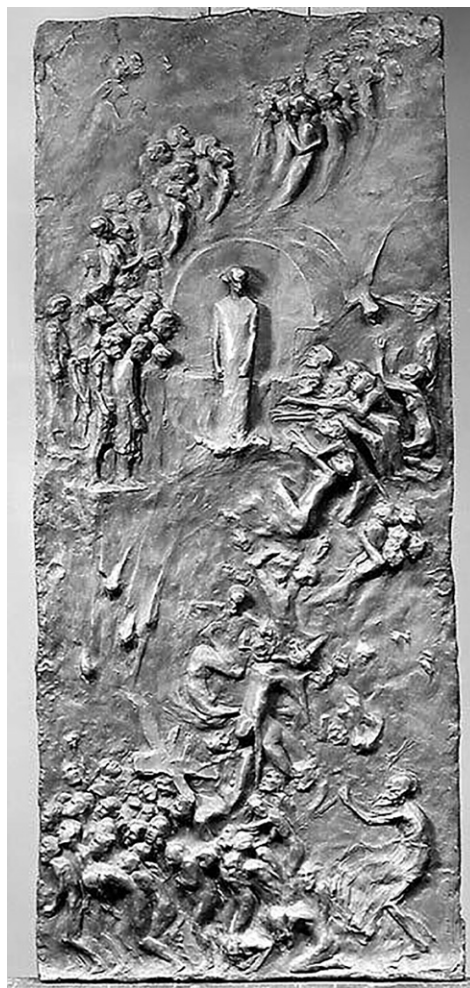
III. 5 Gustav Vigeland: Dommedag , 1894. Bronse, 122 x 53,5 cm. Nasjonalmuseet.