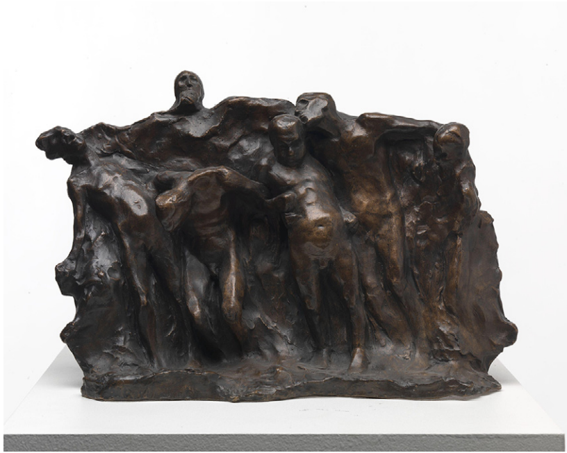
III. 4 Gustav Vigeland: Drankerne , 1893. Bronse, 24,5 x 40 cm. Nasjonalmuseet.