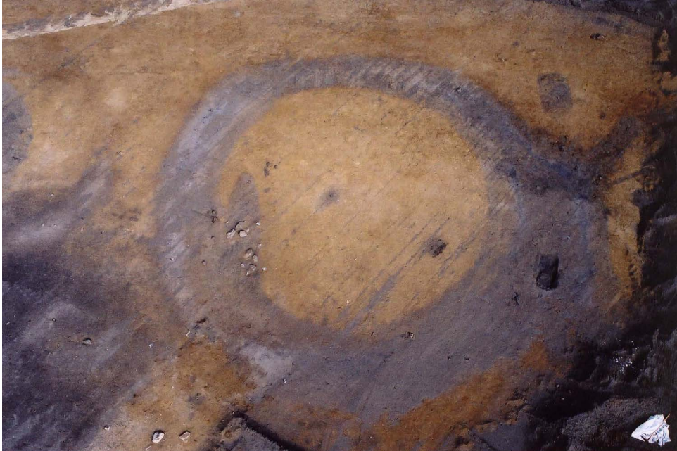
Figur 2 Den eldste båtgraven på Gulli, delvis ødelagt av en yngre fotgrøft. Båtgraven ses som en mørk skygge med stein i toppen inne i den runde fotgrøfta.

nord/nordøst-sør/sørøst. Fotgrøften som ødela båtgraven kan dermed ha vært den første i den andre og siste fasen med gravlegging på Gulli. En ny slekt har overtatt utsikten mot de tapte farvann, og beholder den i hvert fall til ca. 950. De knytter seg på denne måten til fortiden gjennom en oppfunnet tradisjon og et falskt kollektivt minne, og får legitimitet fra fortiden (Bradley 2002:17), samtidig som skillet mellom den nære og den fjerne fortiden blir uklart (Lund og Arwill-Nordbladh 2016:431).