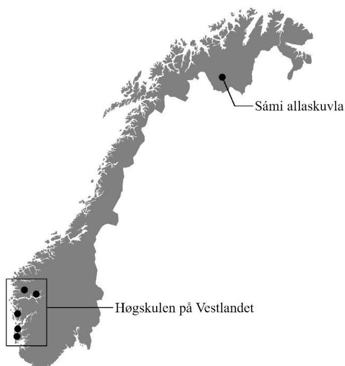
Figur 1: Høgskulen på Vestlandet og Sámi allaskuvla

HVL er ein av dei største høgskulane i Noreg, med om lag 16 000 studentar og 1 600 tilsette. Han tilbyr mange ulike studieprogram, fordelte på fagområda helse- og sosialfag, idrett, friluftsliv og folkehelse, ingeniør- og maritime fag, lærar- og musikkutdanning, natur- og samfunnsfag og økonomi og leiing (Høgskulen på Vestlandet, 2019a). HVL tilbyr bachelor-, master- og ph.d.-program og vidareutdanning. Institusjonen er spreidd over fem studiestadar, med ein avstand på om lag 400 km frå lengst sør til lengst nord. Alle dei fem studiestadane