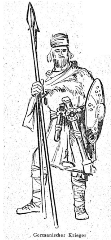
En germansk kriger, Helm, Kamps neues Realienbuch , (Druck: Ferdinand Kamp Bochum.,1952),.30

De hadde et rent familieliv, « ..ein reines Familienleben.. » hvor utroskap ble straffet hardt. Kvinnene var flinke i håndverk som spinning, veving og keramikk, tapre og gode rådgivere til mennene, ble æret av både mennene og barna deres. Noen de hadde likhet med romerne som også satte kvinnene høyt i samfunnet. Men romerne også førte til også til at germanerne kriget med hverandre enten det var over uenigheter eller avhengighet av handel så førte det blodige broderkriger. Det var folkesamlingene som bestemte om hvilke