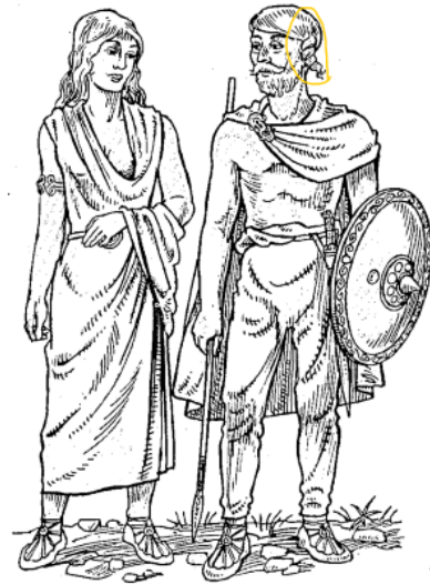
Germanisches Paar zur Römerzeit

Familien er den minste enheten, og som romerne var mannen i familien overhodet og styrte alt. Mannen stod ansvarlig for å beskytte hele husholdningen. Kona var sto under