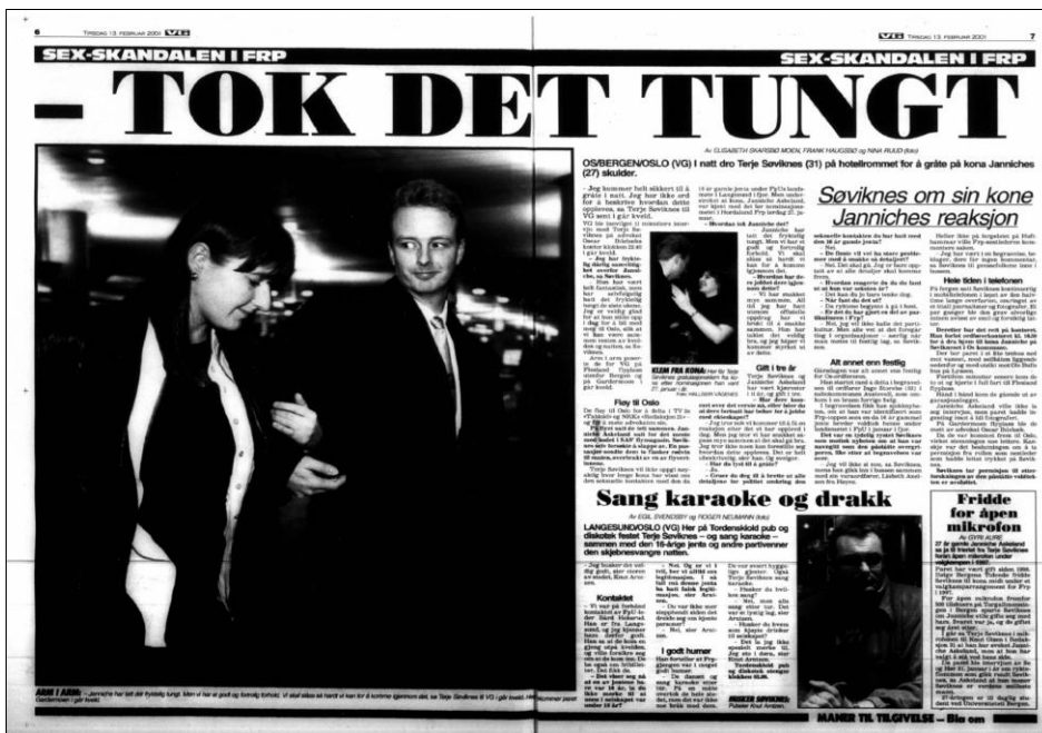
Figur 1 Faksimile VG, 13.2.2001, side 6-7