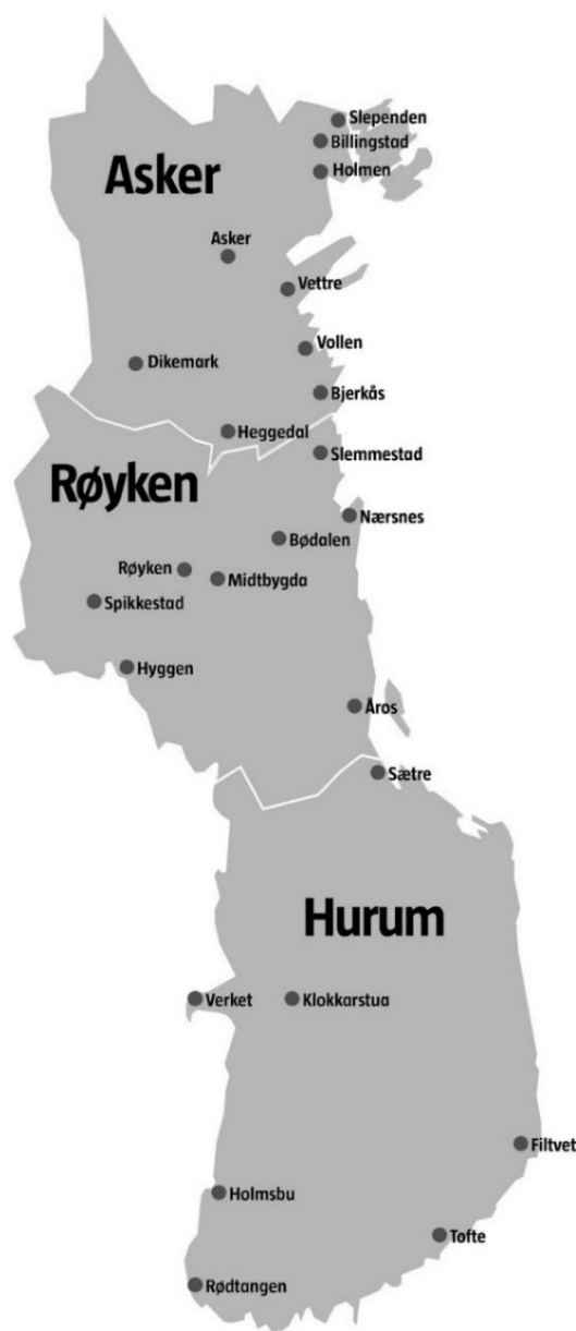
Figur 4.1 Nye Asker kommune

Norske parti er framleis i stor grad medlemsorganisasjonar, sjølv om det samla medlemstalet vart nesten halvert mellom 1990 og 2012 (Allern et al., 2016, s. 40). I denne delen av kapittelet skal vi sjå nærmare på kva som skjer med partiorganisasjonen når kommunar slår seg saman. Partia må som eit minimum ha eit fellesstyre som kan levere