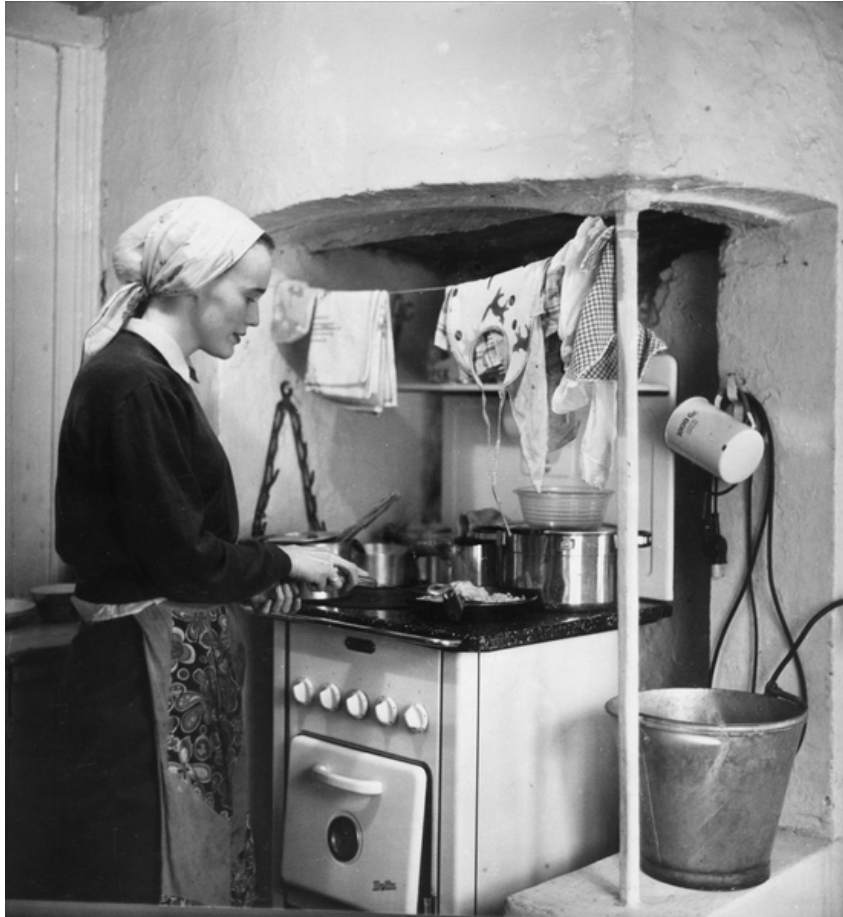
Husmor i Oslo

Det skulle bygges 100.000 boliger de neste fire årene, dette var familiehjem med nye moderne kjøkken som skulle tilfredsstillte husmødrenes krav. Hjemmene trengte en husmor som viste utholdenhet, offervilje og trofasthet ovenfor den oppvoksende generasjon. Og det skulle føres en familievennlig politikk, her skriver Tranmæl at barnetrygden var et viktig første steg. 71 DNA hadde jobbet for dette i mange år, og tok det inn i programmet sitt allerede i 1930. 72