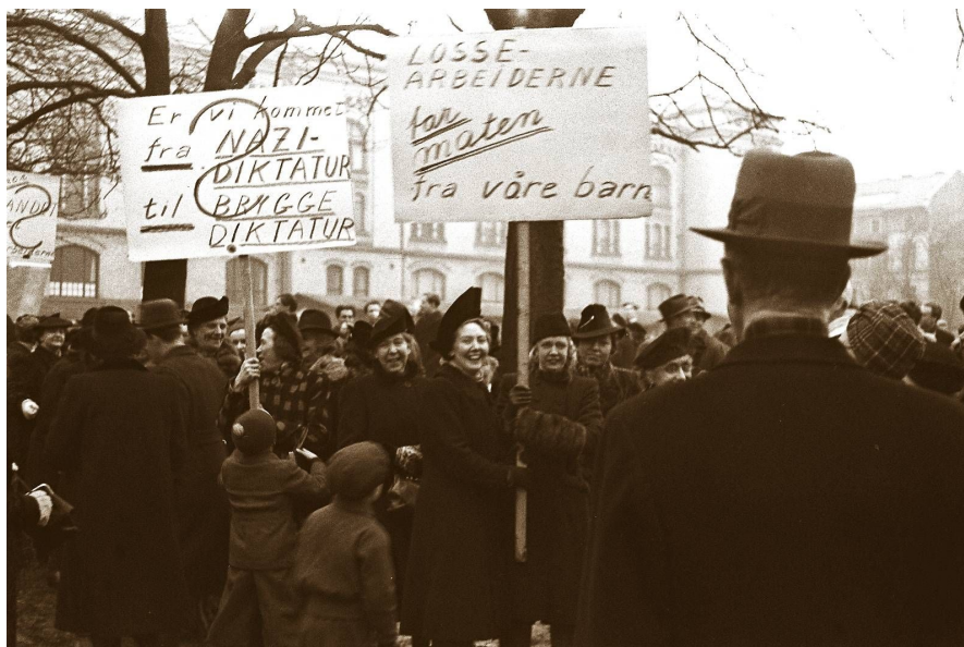
”Tomatkrigen i Oslo”

Bryggearbeiderne stod på sitt, og de hadde støtte langt inn i Gerhardsen-regjeringen. Dagene gikk, og tomatene som lå i lasterommet ble mer og mer modne. Det var bare spørsmål om tid før hele laste måtte dumpes på sjøen. Etter fire dager møter hundrevis av husmødre opp på Tullinløkka for å demonstrere. Kvinnene var sinte og misfornøyde med at tomatene ikke skulle ende opp på norske kjøkken, tomater var tross alt ikke en selvfølge et knapt år etter frigjøringen. Kvinnene fortsatt til Stortinget, og videre ned mot Filipstadkaia.