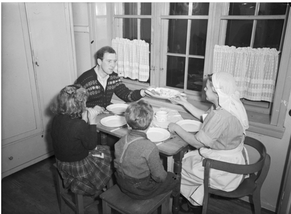
Husmorvikar i arbeid hos ukjent familie

Partiet og arbeiderkvinnene ønsket å øke bevilningene til husmorvikarordningen som de etablerte i 1947. Dette var i hvert fall det politiske budskapet utad. Sosialøkonomer og folk i arbeidsmarkedsetaten mente at husmorvikarordningen var en pådriver for å få flere husmødre ut i arbeid. 162 Var dette en utvikling som DNA ønsket velkommen? Selv om man så hvilke tiltak som trengtes for å kombinere arbeid og familie, og legge til rette for yrkesarbeid for husmødre, blant annet husmorvikarordningen. Ble dette i begrenset grad omsatt i handling. Diskusjonene strandet ofte på grunn av manglende bevillinger. Når staten ikke gikk inn med økonomisk støtte, ble resultatet av husmorvikarordningen mangelfull og løste ikke problemene for en husmor som ønsket å ta seg lønnet arbeid. 163