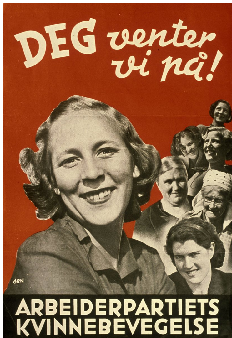
Arbeiderpartiets valgkamplakat

Den normale tilstanden for ei kvinne var husmorrolla. Var ho fornøgd med kjøkenbenken? Ingen spurde henne.