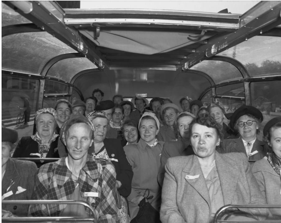
Husmødre på vei til husmorferie

avklart når det kom til hus og hjem. Skulle menn ta en større del av husarbeidet, måtte det en langvarig prosess til, sannsynligvis var det også derfor husmorrollen bestod i så mange år. Vi må anerkjenne at med den oppdragelsen norske menn har fått, vil de ikke kunne gjøre like mye i huset som kvinnene. Selv om mennene er aldri så flinke. Samfunnet må begynne allerede tidlig i barneårene, og heimkunnskap for både gutter og jenter er første steg i riktig retning. 155