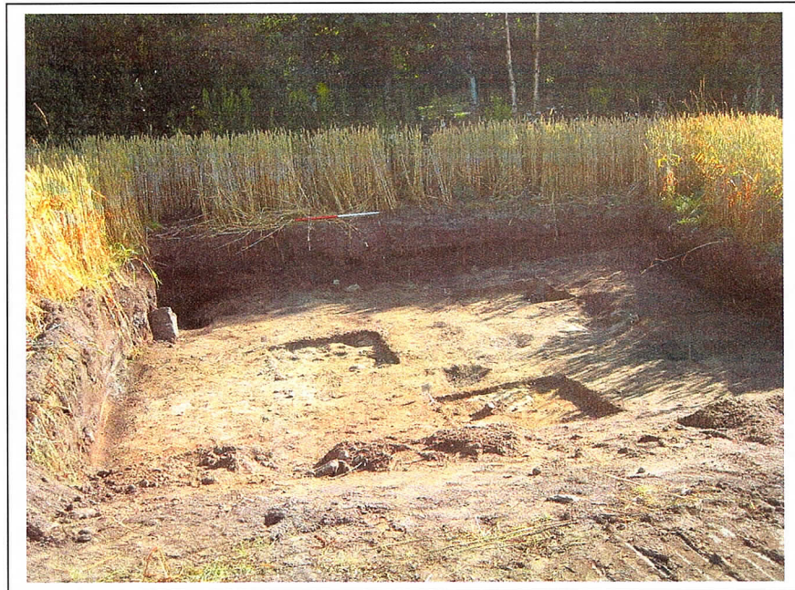
Oversiktsfoto av prøveruter på lokalitet 57.

Steinalderlokalitet i dyrket mark. Molteberg nordre 647/4, Fredrikstad kommune, Østfold Undersøkt i 2004 Christine Stene