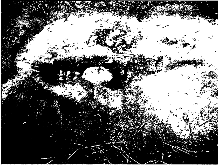
Figur 3: S-3251 profil. Foto tatt mot vest.