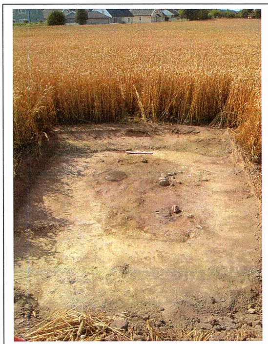
S-3251, lokalitet 18.