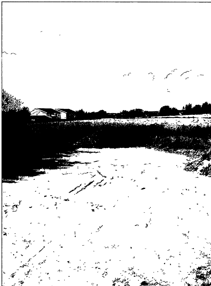
Figur 1: Oversiktsfoto tatt mot nordvest. På bildet kan vi skimte hus 1 ved lokalitet 21. I dyrket mark, ved åkerskillet til høyre på bildet ligger lokalitet 18.

Lokaliteten ligger i dyrket mark i svak sørøstlig helling. På nordsiden av jordet er det flatt berg oppe i dagen. Lokalitet 18 ligger på det høyest liggende jordet på sørsiden av E6, med vidt utsyn ut over åkerlandskapet. Det ligger boliger sør, sørvest og nord for lokaliteten, samt på motsatt side av E6.