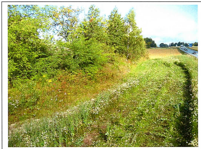
Oversiktsfoto lokalitet 22 for avdekking.