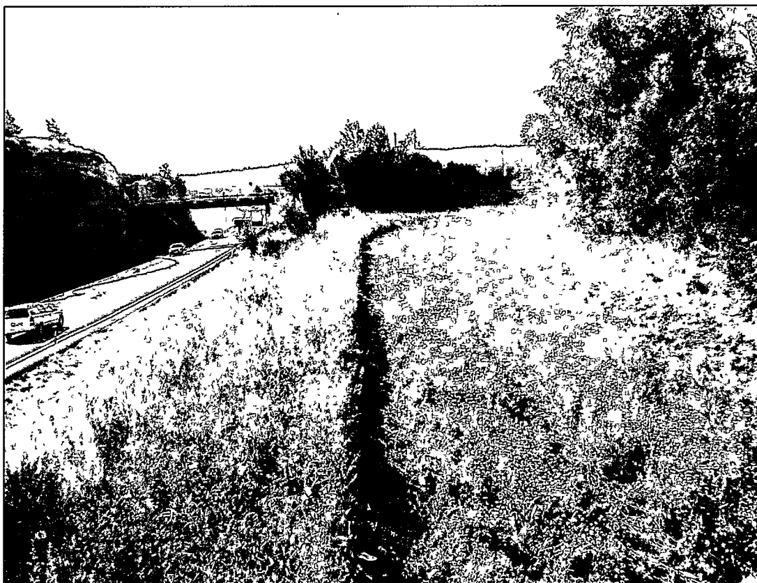
Figur 1 Oversikt mot sørøst over lokalitet 22.

Det var ikke mulig å påvise noen sammenheng mellom strukturene, og de kan derfor ikke tolkes som spor etter en boplass. Det er imidlertid mulig store deler av en eventuell boplass har blitt fjernet i forbindelse med anleggelsen av E6 som løper parallelt med lokaliteten. Strukturene kan også være spor etter et aktivitetsområde i utkanten av en boplass som har ligget i nærområdet, eller etter et kortere opphold på området.