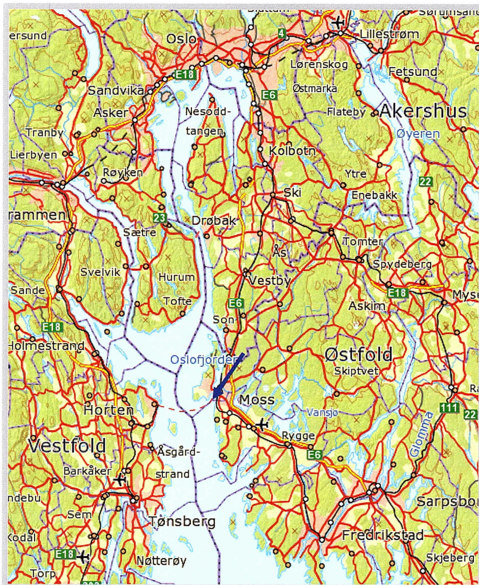
Figur 1: Kart over funnsted. Blå pil markerer Kleberget 38. Målestokk 1:600 000, kart hentet fra Matrikkelen. Kart ved Anne Skullerud, Østfold fylkeskommune.

Fredag 08.04.2011 foretok Fylkeskonservatoren en forundersøkelse av utearealene i Kleberget 38. Formålet med undersøkelsen var å se om det fantes spor etter forhistoriske strukturer i overflaten som kunne stå i fare for å bli ødelagt. Området rundt de store steinblokkene som var angitt som sannsynlig opprinnelig funnsted, ble rensket for løv og løsmasser (murstein, søppel o.l.) med krafse. Deretter ble det gått over med metallsøker. Det ble anlagt en profil rett vest for steinene, ytterst på «hyllan». Profilen viste at det hadde blitt påført masser også i dette området. Det ble for øvrig bemerket at de store steinblokkene synes å være flyttet på. Også det området der betalingsringene ble funnet i deponerte masser, ble søkt over med metalldetektor. Det ble ikke funnet spor etter forhistoriske strukturer. Det ble heller ikke gjort ytterligere funn i overflatelag ved forundersøkelsen (Skullerud 2011).