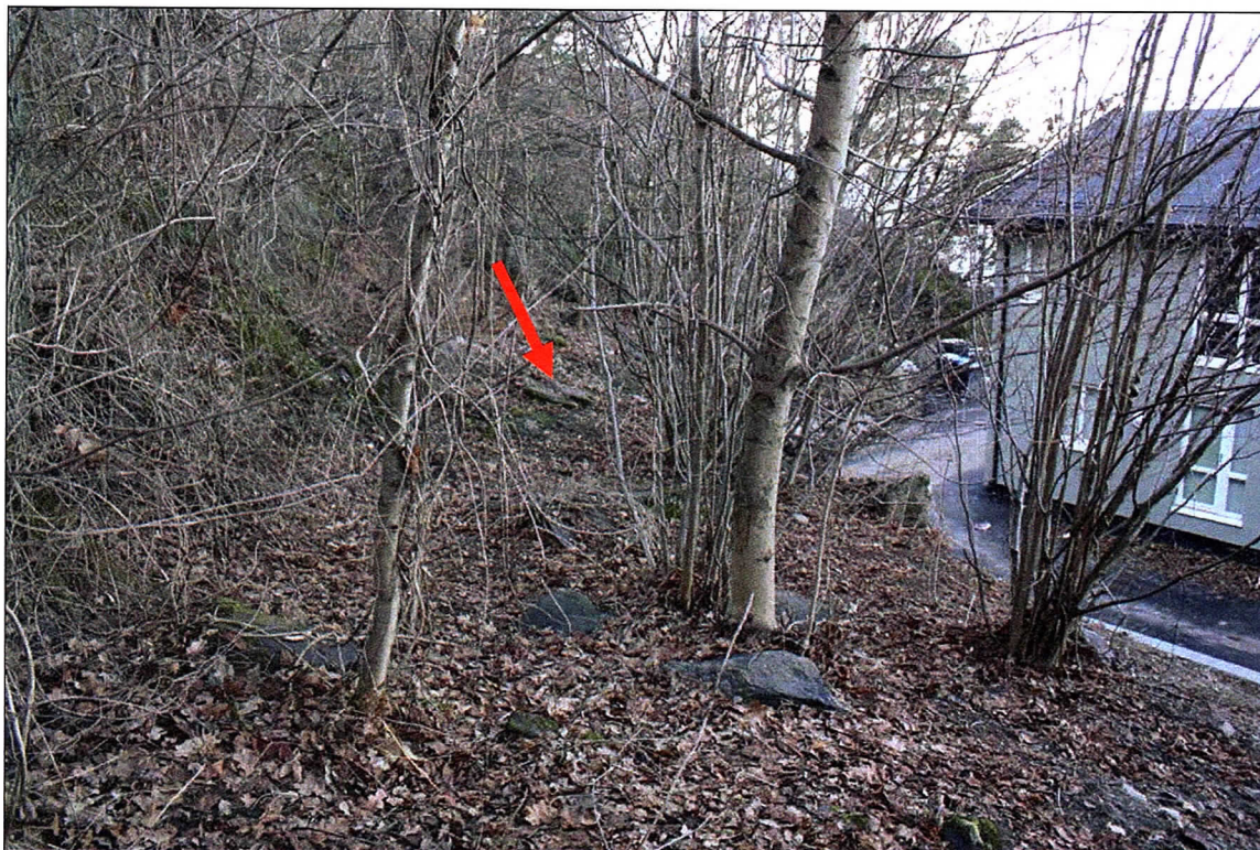
Figur 7: Hylle med løse steinblokker. Den flate steinblokken i midten av bildet ved den røde pilen kan ha sammenheng med opprinnelig funnsted. Retning mot SV.

Det ble ikke funnet kull eller annet av interesse ved avdekkingen, og det ble derfor ikke tatt ut noen prøver. Betalingsringene ble gitt museumsnummer C58014/1-3.