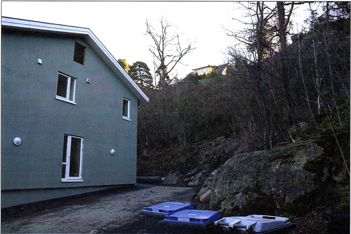
Figur 3: Innkjørselen til bakgården i Kleberget 38 med sørøstre hushjørne.

Betalingsringene ble funnet 15 m sørøst for sørøst-hjørnet av bolighuset. Fra funnstedet er det god utsikt vestover mot Jeløya og Horten. Det er ryddet rundt funnstedet da det ligger i hagen på eiendommen, men skråningen er ellers bevokst med løvskog (se fig.3).