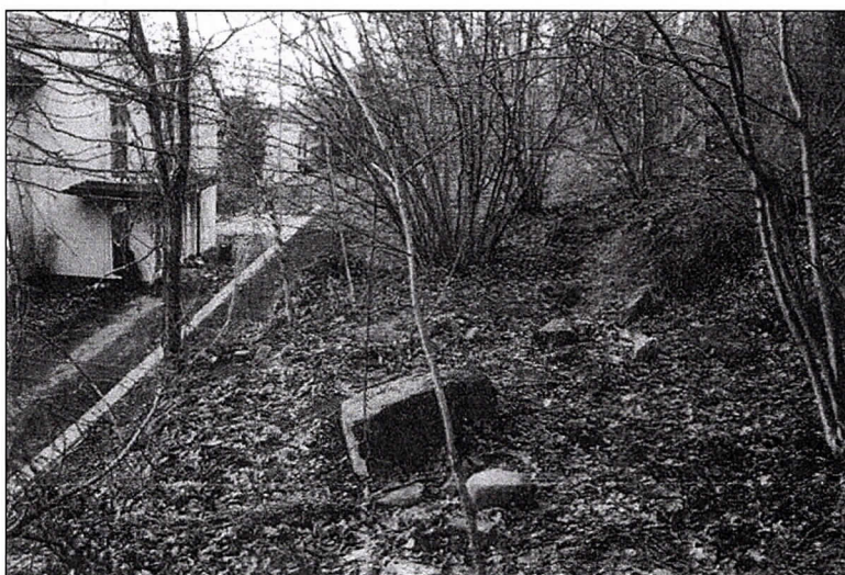
Figur 5: Sti/tråkk forbi mulig opprinnelig funnsted ved steinblokk midt på bildet. Sett mot N.