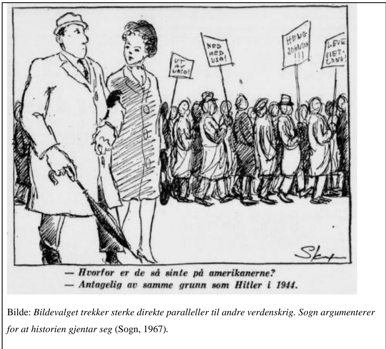
Bilde: Bildevalget trekker sterke direkte paralleller til andre verdenskrig. Sogn argumenterer for at historien gjentar seg (Sogn, 1967).

Sogn argumenterer her for at kommunistiske krefter fortsatt vil fare frem, selv om «vestlige demokrater» skulle lansere et nedrustningstilbud. Implisitt sier han dermed at USAs rolle i krigen er helt nødvendig, på tross av økende motstand i form av økende negativ opinion. Dette er et bilde han tydelig visualiserer gjennom bildevalget til teksten, hvor det atter en gang trekkes en parallell til andre verdenskrig.