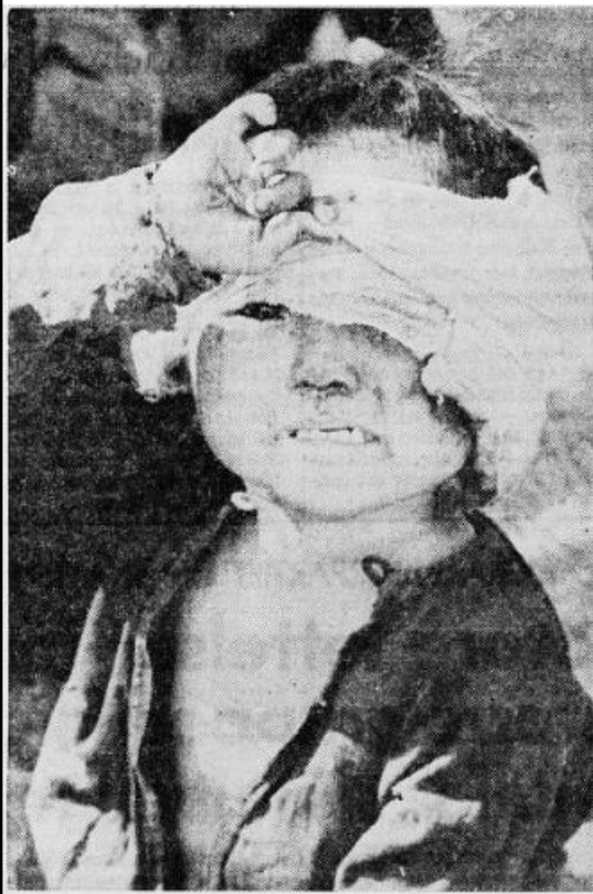
Bilde: Fotografiet av den vesle, gråtende gutten sammen med teksten som etterlyser hjelp, går rett inn i humanitær aspekt-rammen (Morgenbladet, 1967).