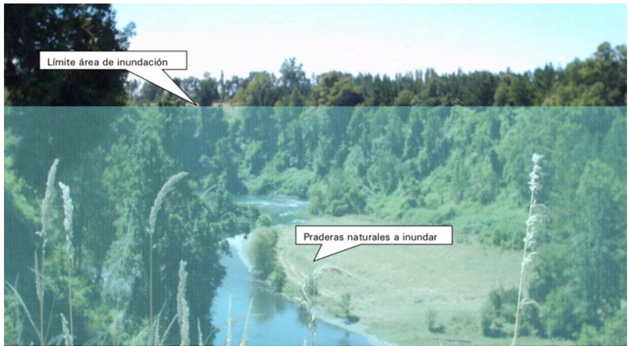
Figur 4. Prosjektet Osornos opprinnelige påvirkningsområde slik det fremkom i miljøstudien fra 2007. «Foto J2.17. Área de inundable con proyecto». Fra EIA Central Hidroeléctrica Osorno (2007). Anexo J2, s. 10. Empresa Eléctrica Pilmaiquén S.A./Ingendesa. Hentet fra http://seia.sea.gob.cl/archivos/400_20070905.193011.pdf