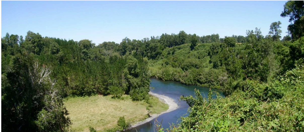
Figur 2. Bildet viser det opprinnelige påvirkningsområdet til prosjektet Osorno slik det fremkom i miljøstudien fra 2007. «Foto J2.9 Cuenca visual área de influencia del proyecto». Fra EIA Central Hidroeléctrica Osorno, Anexo J2, s. 5. (2007). Empresa Eléctrica Pilmaiquén S.A./Ingendesa. Hentet fra http://seia.sea.gob.cl/archivos/400_20070905.193011.pdf