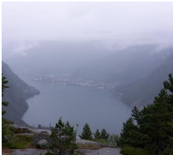
11 Utsikt frå Lilletopp mot Eitrheimsneset Juli 2017

Opp til Lilletopp frå Tysso I er det ein «Via Ferrata» som er ei tilrettelagt klatreløype med stigetrinn og fester, i utgangspunktet er delar bygd i anleggstida. Her har Trolltunga active i samarbeid med NVIM guida klatreturar. Klatreturane byrjar med visning av eit biletspel på NVIM ved Sørfjorden,