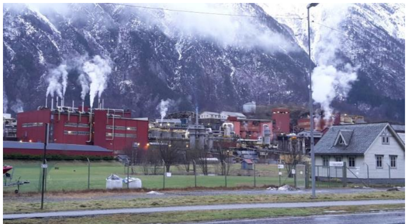
14 Boliden, Januar 2018

Klimaendringar har og konsekvensar for Odda, og Odda har vore med på å skape klimaendringar. Klimaendringane har meir globale konsekvensar enn lokal forureining, men har og meir globale årsakar. Resultatet av klimaendringane er mange, for mange til å gå gjennom her, men eg kan kort seie at utslepp av karbondioksid og andre klimagassar som skjer i ulike forbrenningsprosessar føres opp i atmosfæren. Røyken var vanleg i Odda og andre industribyar tidlegare. «Det er røyken vi lever av» kunne dei sei lokalt. 181 I dag ligg ikkje røyken like tett over fjorden som han gjorde då fabrikkane gjekk for fullt, men du ser han framleis ut or pipene til Titanverket og Sinkverket. Dette gjer at miljøproblematikken framleis blir opplevd som nær når eg er i Odda, spesielt sidan industrien er synleg nesten uansett kvar du er.