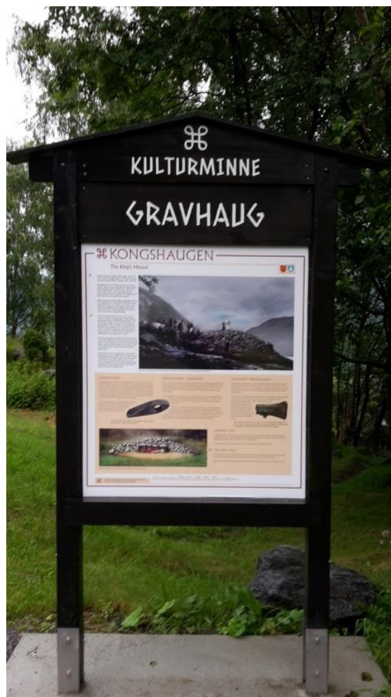
4 Gravhaug

Odda har fleire kulturminne frå denne perioden, og fleire av dei er merka. Desse møter ein fort på biltur gjennom Odda, og dei er fine turmål, bygdeborga ved Sandvin er til dømes ein flott stad å henge si køye, noko eg gjorde ein sumarnatt på feltarbeid. I tillegg til bygdeborg ligg det og ein gamal gravhaug nordvest for Odda sentrum, kalla Kongshaugen. 118 Den har i dei seinare år fått ei infotavle med markering som kulturminne, det same har bygdeborga. Grunnen til at eg har valt å omtale dei her er den klare designen, som ein ikkje finn i andre skilt i kommunen. Det er interessant, for hadde like skilt stått på Lilletopp, i sentrum eller andre stader der det og ligg freda kulturminne hadde det skapt ein kontinuitet frå det førindustrielle til det industrielle. Slik det er no er dei eldste kulturminna meir eller mindre isolert frå den større presentasjonen. Sann som det er i dag er slike eldre kulturminner ikkje like tydeleg som dei meir moderne kulturminna, men dei er framleis til stades. 119