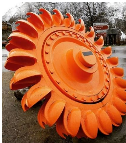
1 Turbinhjul i Tyssedal

Korleis blir Odda presentert av turistbransjen, og kva har hendt i Odda som skapar dette biletet? Kva historie, natur og nåtid er det som blir presentert? Korleis blei Trolltunga ein så stor attraksjon som det er i dag?