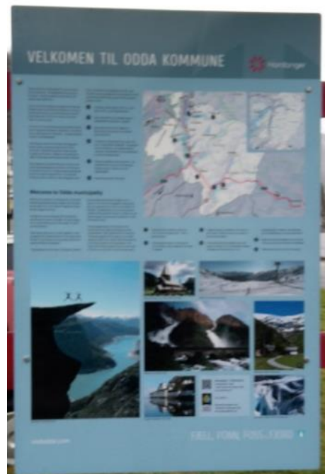
2 Velkommen til Odda kommune

Skiltet «Velkommen til Odda kommune», eit infoskilt som er plassert fleire stader i kommunen, presenterer Odda som staden mellom to nasjonalparkar der «isen har forma det storslagne landskapet med høge fjell, fruktbare dalar og djupe fjordar» 103 Eg har allereie vore innom denne historia, men ynskjer å gå litt vidare på han. Grunnen til at dette er viktig er ikkje nødvendigvis for alt det som er skrive om Odda, men korleis Odda er presentert via bilete. Odda er ein stad i naturen, meir enn ein stad med natur i seg. Nesten uansett kva som blir presentert er naturen eit tydeleg rammeverk. Dette er delvis fordi naturen har skapt ei tydeleg ramme rundt Odda, staden mellom fjord og fjell, men og fordi denne ramma er sett på som vakker. Om me ser på Visitodda