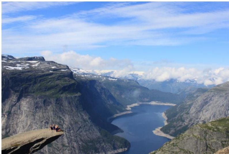
8 Trolltunga Juli 2016.

Nå skal me ta eit lengre augneblink ved Trolltunga, Hardanger sin uoffisielle logo. Her ser du ein versjon av biletet som du ikkje finn i turistsjyrene, fordi dette er eit bilete av meg frå Juli 2016, andre gong eg var på Trolltunga. Dette biletet tok eg ikkje som forskar på feltarbeid, men turist til