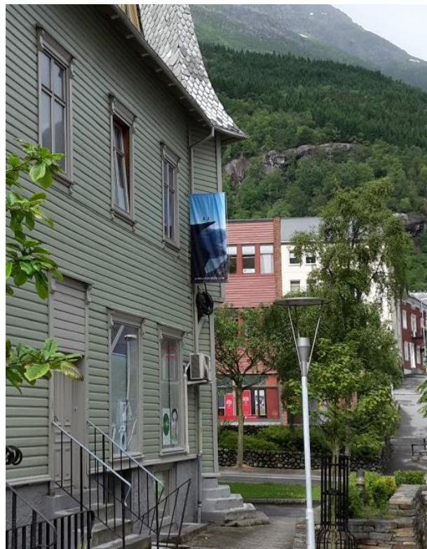
7 Turistreklame i Odda sentrum.

Trolltunga er eit tydeleg symbol som er i bruk overalt i Odda på mange ulike måtar. Det er bilete av Trolltunga hengt opp langs hovudgata, på turistbrosjyrar og i logoar. I glasvindaugget til Skoringen heng eit stort bilete av to hardingar i bunad, hoppande på Trolltunga med eit Skoringenbanner, på toalettet på bensinstasjonen er Trolltunga tapetsert på veggen i fleire kvadratmeter, den lokale sportsbutikken reklamerer for å selje det beste utstyret til å ta turen, Hotell Hardanger har malt Trolltungagrafitti på eine kortsida av hotellet. Dette er ikkje bedrifter som har vore politisk styrt til å bruke Trolltunga i sin reklame, men lokale initiativ. 137