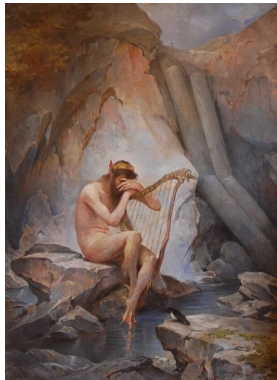
5 Fossegrimen av Nils Bergslien

med industriutbygginga og opp eit hotell, Tyssedal hotell, som i dag er ein turistattraksjon mellom anna på grunn av den store biletsamlinga. I fyrste etasje er det utstilt maleri av Nils Bergslien, Christian Krogh og mange fleire kunstnarar frå seint 1800-tal. Desse maleria har motiv både frå natur, kultur og industri. Av særskilt interesse er maleria til Nils Bergslien (som opphavelg var frå Voss og som har malt mange Hardangermotiv). Desse har fleire lokale motiv, deriblant Tyssø og Tyssen (som og er brukt i utstilling i NVIM) og Fossegrimen (ein mytologisk figur som bur i fossen). Fossegrimen er i Bergslien sitt maleri ser lite nøgd ut med at fossen havnar i røyr, og illustrerar spenninga mellom det nasjonalromantiske og det rasjonelle i Hardanger.