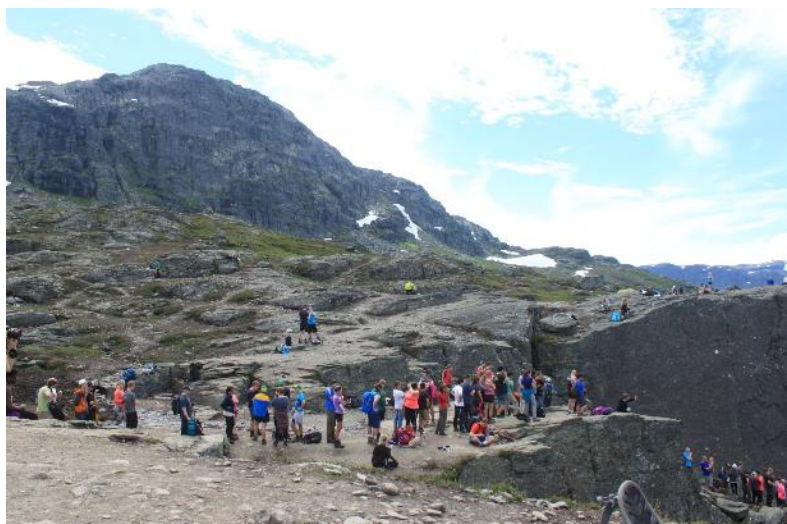
9 Trolltungakøen.

Urry meiner og at turistar som ynskjer å besøke ein stad risikerer å øydelegge det dei ynskjer å sjå på, på grunn av masseturismen. 165 Turistar ynskjer å møte det autentiske, uskada landskapet. Eg trur at det er meir eller mindre umogleg at Trolltunga blir øydelagt av masseturisme, på grunn av det reine Trolltungabiletet. Eg har vore på tunga to gonger, ein gong i 2013 og ein gong i 2016. I 2013 var det om lag 20-30 turistar omkring Trolltunga kvelden eg var der, og det var ingen kø. I 2016 var det fleire hundre turistar og i underkant ein time å stå i kø. Likevel er minnet av desse to turane ganske like. Biletet frå desse to turane er nesten heilt like. Turistane presenterer ikkje bilete av køen. For å sette det på spissen trur eg ikkje at eit høg fjellshotell eller ein hyttelandsby rett bak fotografen vil endre turistbiletet. På grunn av at biletet sikter den vegen det gjer, vekk frå sjølve turen, og ut mot det spektakulære