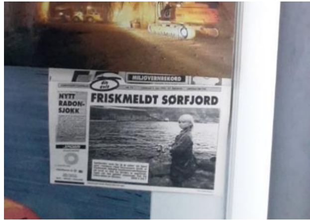
13 Sørfjorden friskmeldt

Sørfjorden. 180 Dette passar dårleg saman med ein fjord som er friskmeldt. For å vere presis er det ikkje slik at NVIM sjølv skriv at Sørfjorden er friskmeldt, men når dei tek fram ei avisforside som seier det same, utan å kommentera at ho er feil, sit eg som besøkande igjen med inntrykk av at all forureining i Sørfjorden er forbi.