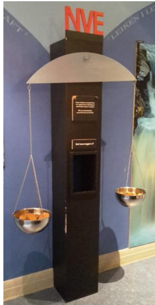
12 Utbyggingens vektskål.

Industri og natur spelar i bilete og presentasjonar kanskje på lag, dvs at det ikkje verker å vere ein sterk kontrast. Samtidig er det slik at industri og natur har ein gjensidig påverknad på ein annan. Er det rett å framstille industri i samspel med naturen? Kva effekt har industri på natur? Naturen sin effekt som ressurs for industrien har eg alt gått igjennom. Er industrien i Odda farleg for naturen og miljøet i Odda? Farleg i form av at det er skadeleg for naturmangfaldet, at det fører til klimaendringar, eller at det forureinar. Dette er ein tematikk som til ein viss grad tas opp lokalt . NVIM sin utstilling «Foss» ser på konsekvensar av vasskraftsutbygging eller vassdragsvern, same tema er og nemnt i dei andre utstillingane til museet. 171 Blant anna har dei i «foss» ei vektskål, der du kan plassere treklossar med argument for og imot, og sjå kva resultat som til slutt veg tyngst.