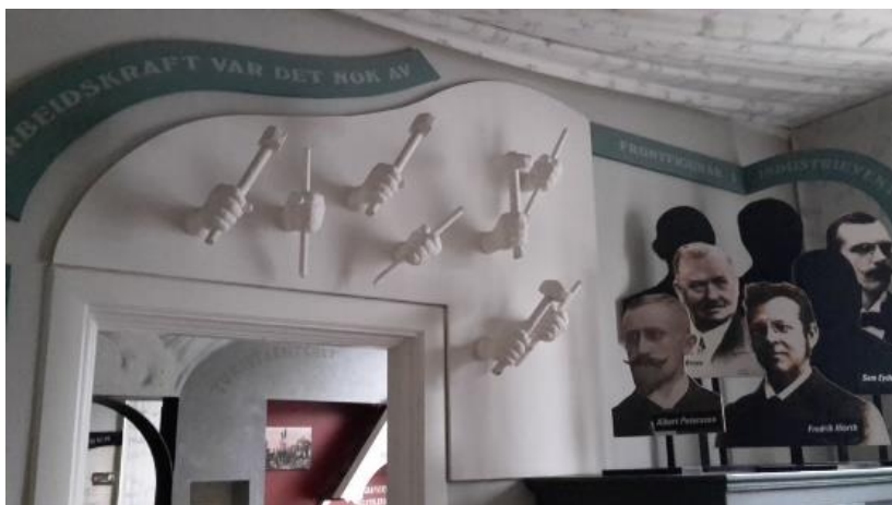
3 Industrierar og arbeidshender

Denne teksten er henta frå eit av fleire infoskilt som heng rundt i kring på smelteverkstomta, og som er produsert av NVIM. Odda gjekk frå å vere ein liten stad med under tusen innbyggjarar til fleire tusen på få år. Dette er «det store spranget» slik det heiter i