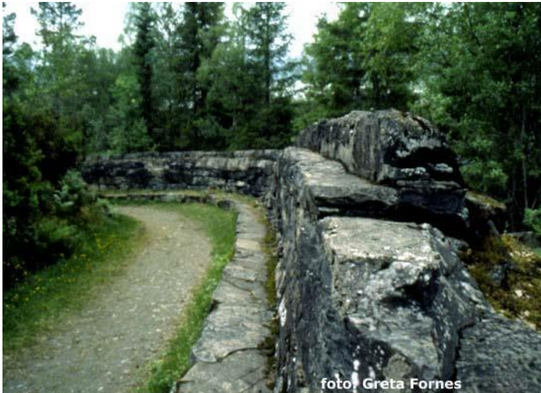
Skyttergrav m/brystvern (2016)