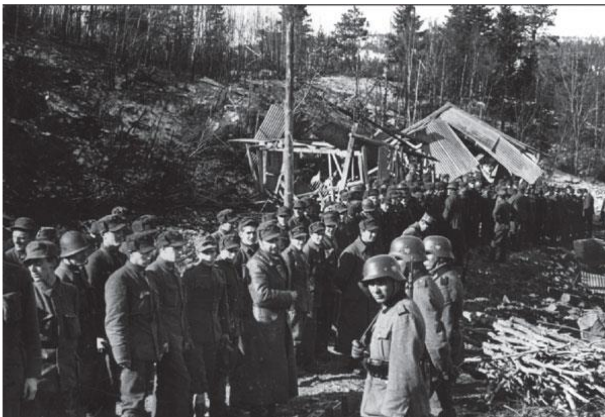
Ved overgivelsen 5. mai 1940