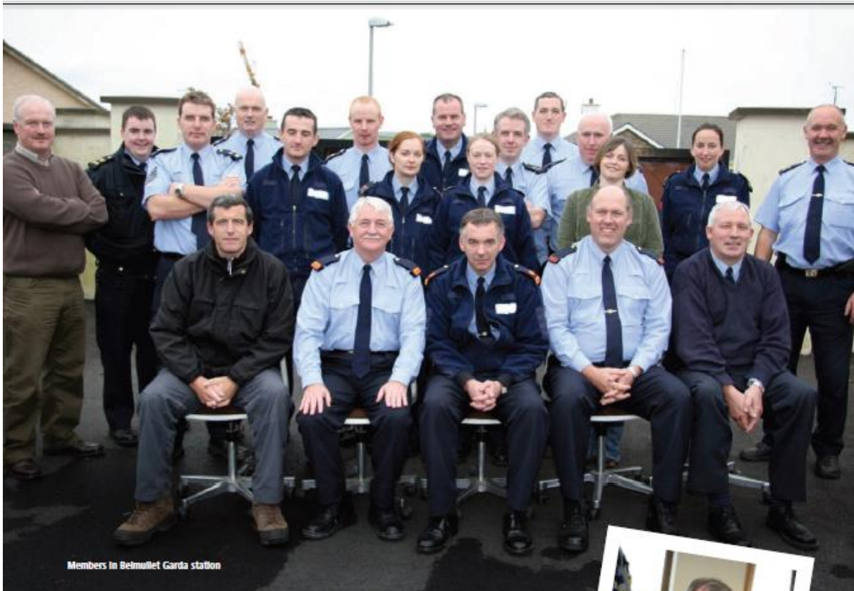
Members in Belmullet Garda station

the wheels locked and everything. I proceeded to do the same with about five more, by that stage we had opened up a channel to the gate so I lined the Gardaí up either side and created a pathway in."