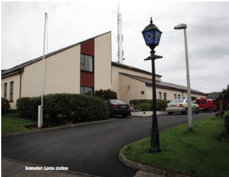
Belmullet Garda station

"It has been rough on some days and on others it has been fairly compliant."