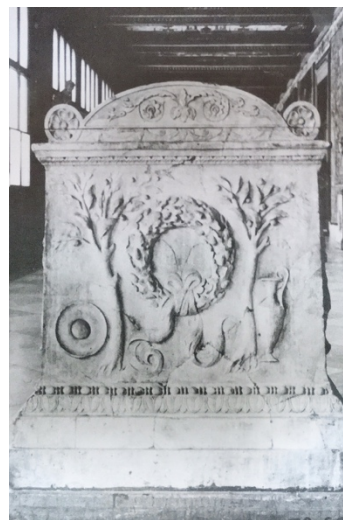
Figur 2. Typiske augusteiske symboler. 101