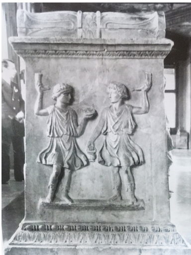
Figur 1. Lares augusti. 100

Den keiserlige symbolikken som ofte dekorerte altrene tilknyttet vicomagistri var mer enn kun utsmykkende dekor. Symbolikk kunne bidra til å skape gjenkjennelighet i nabolagene i sammenheng med vicomagistri sitt arbeid, noe som igjen kunne styrke deres tilstedeværelse. Symbolikken på altrene kommuniserte ut mening og innhold som skulle knytte bestemte ideer til altret, og det hadde en funksjon og mening. 99