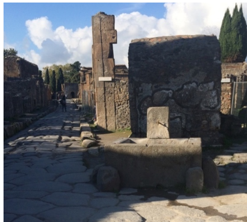
Figur 5. Typisk vannpost i Pompeii, i krysset mellom Via Consulare og Vicolo di Narciso. 169

aedilene, som var på et nivå over dem i byadministrasjonen, og som hadde ansvar for å holde oppsyn i byen. 165 Sammen jobbet de med matforsyningen til befolkningen, og for å forhindre brann og kriminalitet. Reguleringen av kornutdeling til byens borgere var allerede påbegynt under Caesar i republikken, og ble videreført under Augustus. Hvem som hadde krav på korn, ble registrert ved å telle antall beboere i hvert hus, med en gjennomføring av det som ble kalt census . 166 Branner i den svært tettbebygde bebyggelsen i Roma, skapte ekstreme personlige, politiske og økonomiske konsekvenser. Vicomagistri hadde også ansvaret for vannforsyningen til nabolaget og innbyggerne, noe som betydde å holde oppsyn med fontener og vannposter. 167 Arkeologiske eksempler på dette har vi fra Pompeii, der vannposter var plassert ut med jevne mellomrom i nabolagene, slik at de var lett tilgjengelig for alle. 168 Bildet under viser hvordan en vannpost også kan ha sett ut i Roma, dette er tatt i Pompeii.