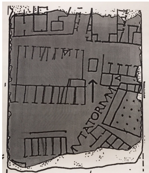
Figur 7. Bildet viser et mulig veikryssalter.

Fragmentene på bildet over av Vicus Stablarius viser oss flere gater, og langs med butikker og leilighetshus, insulae . Nabolaget var trolig større enn kun det som er bevart i fragmentene. 186 Ut mot veien er det vendt rom, i flere ulike størrelser, som ofte var kombinert butikk og bolig for den som hadde utsalg der. Utsalgene ligger på rekke og rad, nedover det som muligens var hovedgatene i dette nabolaget. Navnet på nabolaget er skrevet inn nedover den bredeste gata. Det var ikke vanlig å markere monumenter eller altere på forma urbis, men disse fragmentene er et eksempel hvor det faktisk er markert et monument som kan ha vært et veikryssalter ute i veikrysset. Dette kan ha vært et alter, fordi plasseringen passer godt med det vi vet, at det var ofte plassert i veikryss, og dette er også trolig et sentralt sted i nabolaget ettersom det er butikkrom ut mot gatene i området rundt alteret.