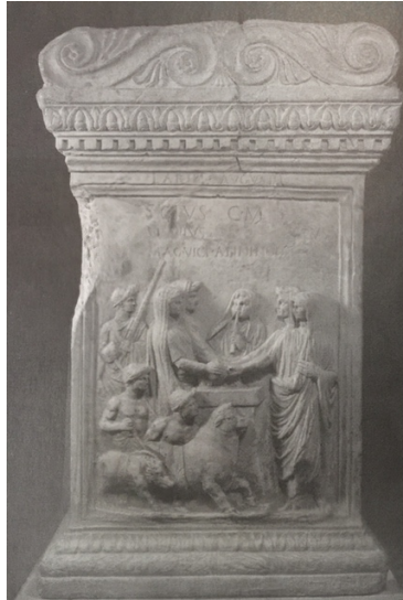
Figur 3. Alter fra vicus Aesculeti. Et offer utføres av fire vicomagistri. 106

offentlige tjenestemenn, ofte frigitte, som bisto vicomagistri under offentlige feiringer. 105 De mer enklere offerscenene med bare to vicomagistri stående på hver side av et alter, var trolig i en mer hverdagslig sammenheng, eller en mer generell fremstilling av presteskapet.