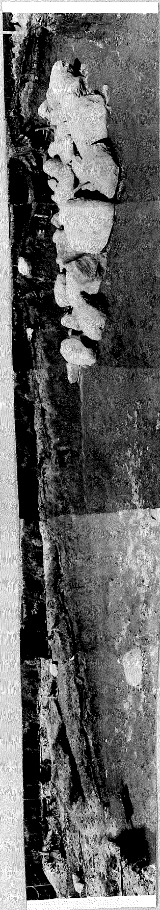
PROFIL HAUG 35.