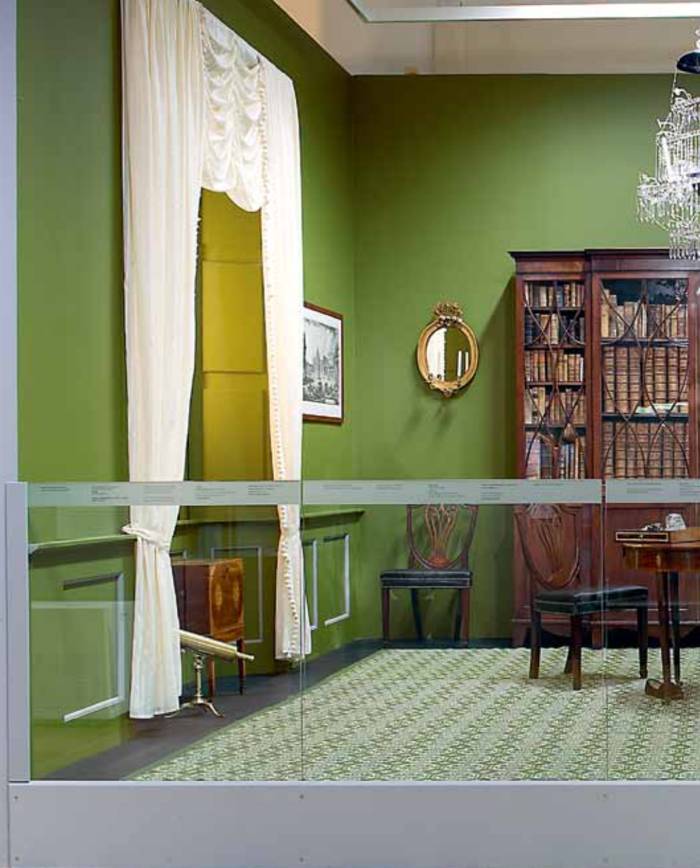
Bernt Ankers kontor och soverum i Paleet som det rekonstruerades på utställningen Design og Mote. Norge 1814 på Kunstindustrimuseet.

Bernt Anker (1746-1825) Denne utstilling viser et rekonstruert kontor og soverom for Bernt Anker, som ble etablert i 1814. Utstillingen er basert på arkivmateriale og viser hvordan rommet ble innredet og møblert. Utstillingen er en del av utstillingen Design og Mote. Norge 1814 på Kunstindustrimuseet. Bernt Anker (1746-1825) Denne utstilling viser et rekonstruert kontor og soverom for Bernt Anker, som ble etablert i 1814. Utstillingen er basert på arkivmateriale og viser hvordan rommet ble innredet og møblert. Utstillingen er en del av utstillingen Design og Mote. Norge 1814 på Kunstindustrimuseet.