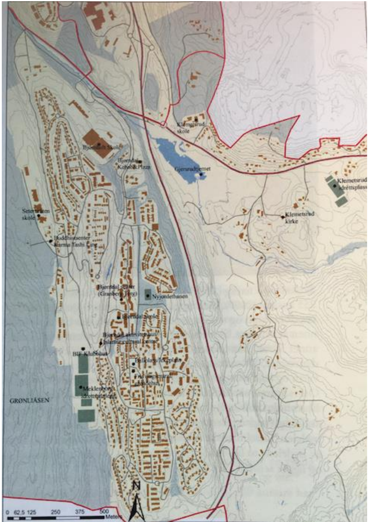
Figur 2 (Guttu og Schmidt 2010)