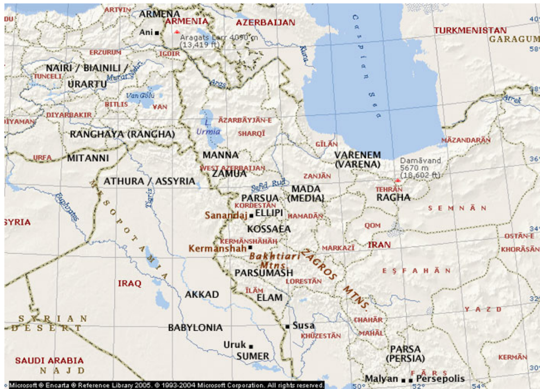
Kart 1: Dette kartet illustrerer noen av nasjonene i det gamle Midtøsten.