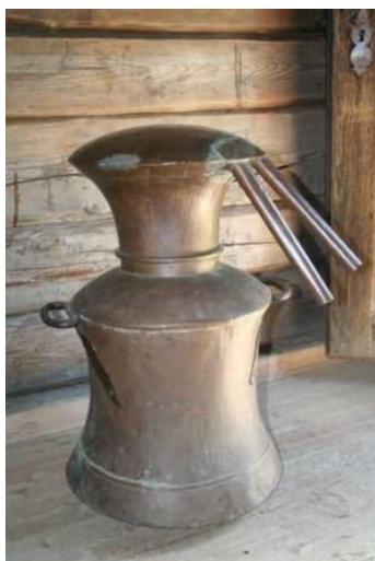
Bilde 5 Svensk brennevinskjel fra 1825 brukt på Funni i Nes.

På sommertingene 1757 176 i distriktet leste fogden opp «Kongl. allernaadigst forordning angaaende Misbrug med Brendeviisdrik at afskaffe med videre udi Norge dat. Christiansborg Slott 8 martii 1757». Med denne forordningen innførte kongen forbud mot