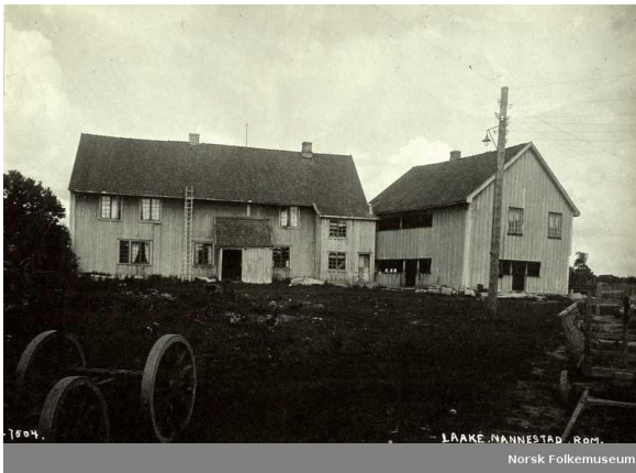
Bilde 3 Lensmannsgården Søndre Låke i Nannestad. Hovedbygningen fra 1710 til venstre og Gammelstubygningen fra 1650 til høyre.

Det står lite eller ingenting i tingbøkene om hvordan tinget var innrettet fysisk, bare at det ble holdt på den og den gården i den «anordnede tingstue». Men tydeligvis var tinget et samlingspunkt i bygda og det kan ha vært mye folk tilstede. Dersom mange fra allmuen møtte opp til tinget ville det ikke bli plass innendørs, så mange ventet antagelig ute til det ble