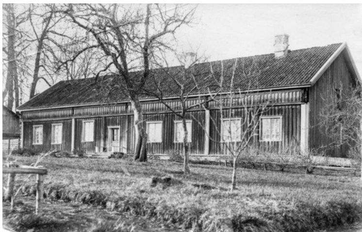
Bilde 2 Hovedbygningen på fogdegården Mork i Eidsvoll, bygget omkring 1730.

skattene han hadde innkrevd hadde tatt veien. Kassemangel forekom også på Øvre Romerike, og som i tilfellet med fogd Købke, var det en vanlig årsak til at fogden ble fradømt stillingen sin.