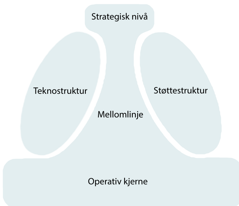
Figur 1: Hovedelementene i en organisasjon (Mintzberg, 1981).

De tre første delene kalles gjerne "linjen" eller linjeorganisasjonen, og betegner det formelle hierarkiet av beslutningsmyndighet. De to siste får ofte betegnelsen "stab" eller stabfunksjoner, og befinner seg på siden av linjeorganisasjonen (Mintzberg, 1981, s. 105; Jacobsen & Thorsvik, 2013, s. 90-92). Visuelt kan de fem hoveddelene framstilles slik: