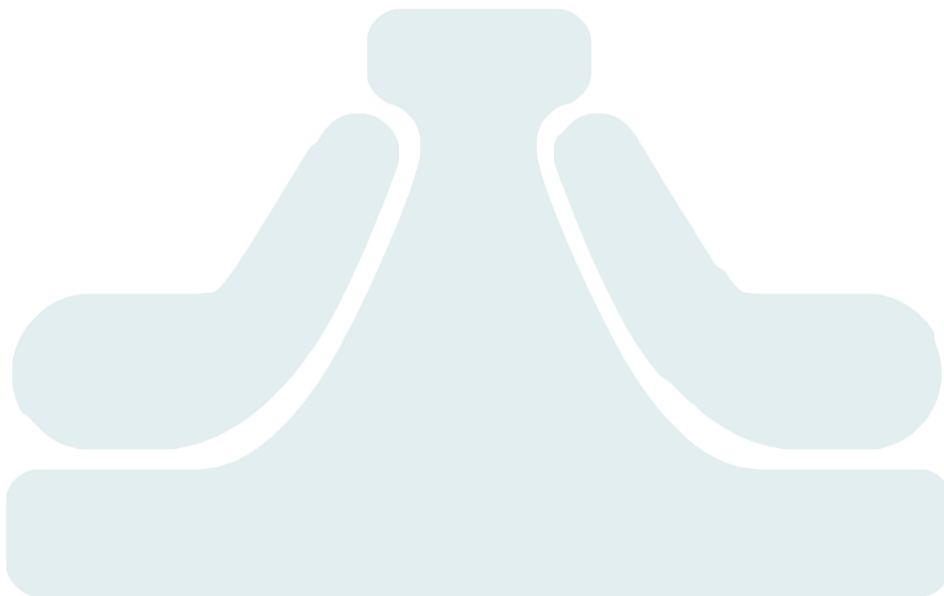
Figur 2: Maskinbyråkratiet (Mintzberg, 1981).

Hoveddelene vil ifølge Mintzberg være representert i mange organisasjoner, og måten de er satt sammen på utgjør organisasjonsstrukturen. 13 Denne tanken oppsummeres i hans anerkjente idé om strukturelle konfigurasjoner 14 (Mintzberg, 1981). Et gjennomgående poeng hos Mintzberg er at organisasjoner utvikler seg i samspill med omgivelsene og situasjonen. Han benytter parametere som kompleks-enkel og dynamisk-stabil for å karakterisere omgivelsene (Engelstad, 2005). Forskjellige verdier på disse parametrene bidrar til å presse organisasjonen i retning av en av følgende fem konfigurasjoner: den enkle strukturen, maskinbyråkratiet, det profesjonelle byråkratiet, den divisjonaliserte strukturen og adhokrati (Mintzberg, 1981, s. 104). Jeg legger vekt på maskinbyråkratiet, ettersom Helfo best kan beskrives ut ifra denne konfigurasjonen. Maskinbyråkratiet bygger på Webers (1971) idealtypiske modell om "det rasjonelle byråkratiet", som sterkt forenklet hadde til hensikt å motvirke tidligere organisasjonsformer preget av korrupsjon og kameraderi (Jacobsen & Thorsvik, 2013, s. 96). Maskinbyråkratiet er ofte svar på stabile og enkle omgivelser, og preges av standardiserte arbeidsoppgaver, høyt hierarki og sentralisert beslutningsmyndighet. Visuelt kan maskinbyråkratiet fremstilles slik: