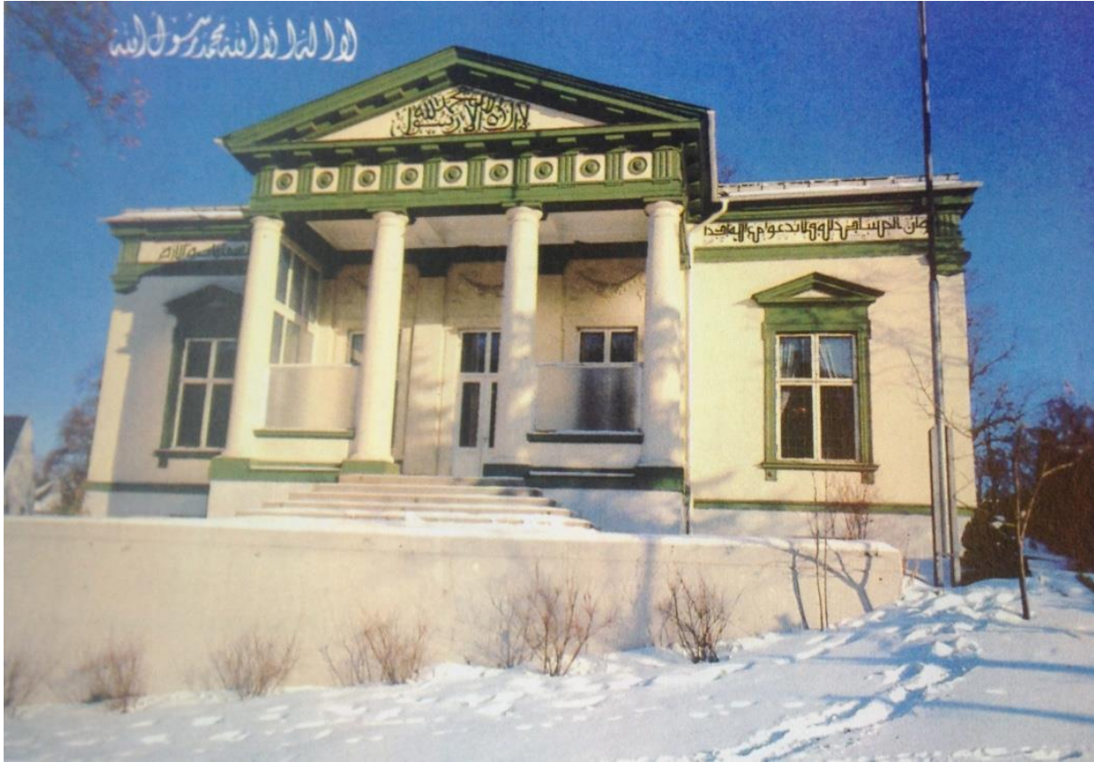
Noor moské.

moskeen, i Frognerveien også. Måten vi hadde åpne dør, sånn som det var felles, og så lukket vi døren og så var mennene for seg selv og kvinnene for seg selv.” 220