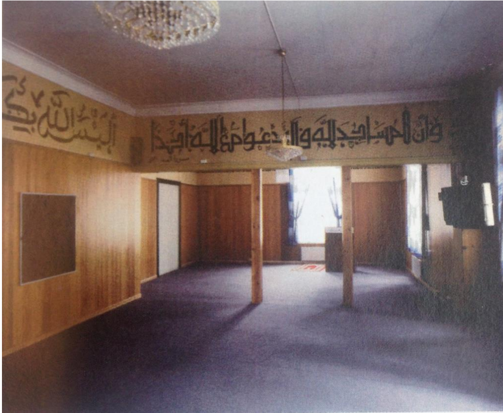
Bilde av bønnesalen i moskeen på Frogner.