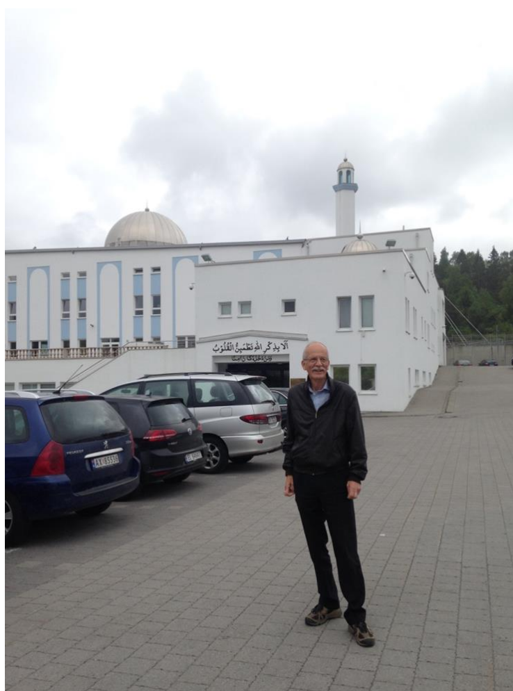
Bilder tatt av forfatteren, vår 2016.

En dokumentasjon av ahmadiyya-menighetens etablering og utvikling basert på Truls Bølstads livsfortelling