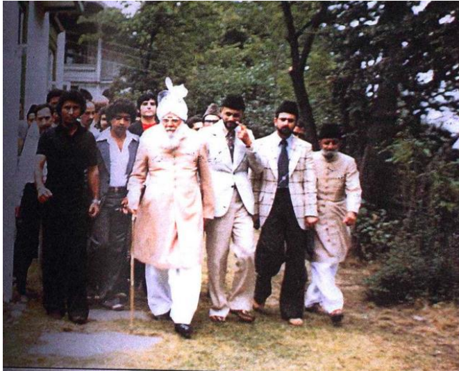
Den tredje kalifen var tilstede under åpningen av Noor moské. Bildet er hentet fra menighetens eget album og gjengitt med Truls sin tillatelse.