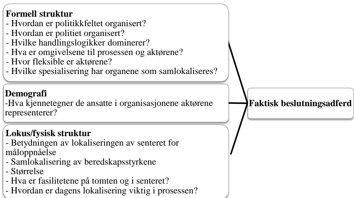
Figur 1: Virkemiddelmodell relatert til prosessen for å opprette et nasjonalt beredskapssenter

Under følger en illustrasjon av virkemiddelmodellen. Her er også elementer knyttet til casen med et nasjonalt beredskapssenter inkludert: