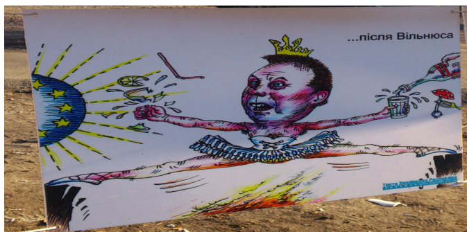
(Bildet er tatt av meg den 18. februar 2014 på Maidan i Kyiv)