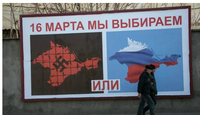
Bilde 2 354

Perioden før annekteringen var preget av frykt, mangel på informasjon eller feilinformasjon. Men ble også hard militærmakt tatt i bruk? Den pro-russiske forkjemperen, Igor Girkin 355 , bekreftet tilstedeværelsen av russiske militære styrker på halvøya før og etter folkeavstemningen. Ifølge Girkin ble folkerepresentanter under deres tilsyn samlet i den krimiske radaen for å stemme på gjennomføringen av en folkeavstemning og den daværende regjeringens avgang. Dette skjedde natt til 27. februar. Ikke bare Girkin bekreftet dette, men også Vladimir Putin innrømmet dette i filmen om Krim som kom ut i mars 2015, ett år etter annekteringen. 356 Selv om den kom ett år etter annekteringen, er dette en erkjennelse av at Russland brukte hard makt for å få kontroll over halvøya, . Det betyr at den såkalte folkeavstemningen foregikk samtidig som at et annet lands militære styrker var til stede, og dermed kan man ikke påstå at det ble gjennomført et fritt valg uten press.