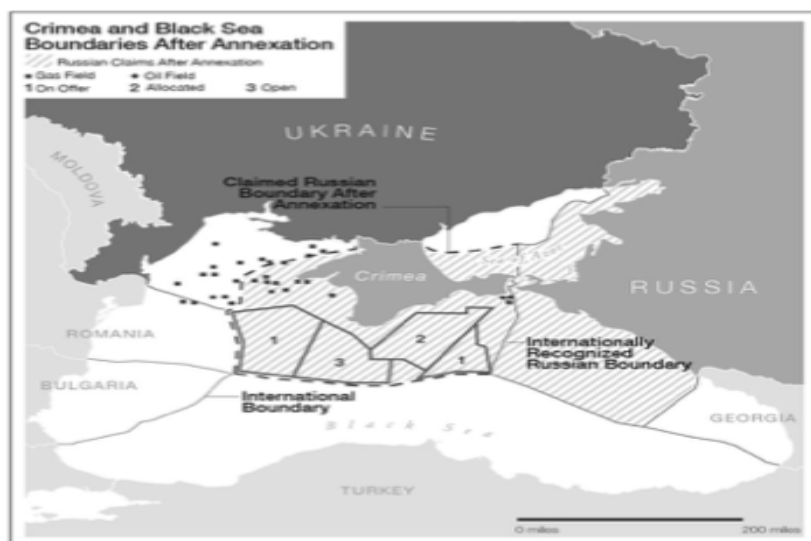
Bilde 3 433

Kontroll over Krim-halvøya hindrer Ukraina i å bruke en stor del av sokkelen i Svartehavet hvor det finnes energiresurser. En videreutvikling på sokkelen ville redusere Ukrainas avhengighet av russisk gass. «Tsjornomornaftogas», som eies av det statlige selskapet «Naftogaz», kjøpte i 2011 to boretårn, og ved hjelp av disse har Ukraina begynt å utvinne gass på denne sokkelen. 434 Selv om de befinner seg nærmere Odeska oblast, fører gassrørene til Krim, som per i dag er under kontroll av den nye regjeringen. Også det ukrainske selskapet «Tsjornomornaftogas», som har sin hovedavdeling i Simferopol, kontrolleres nå av den nye regjeringen.