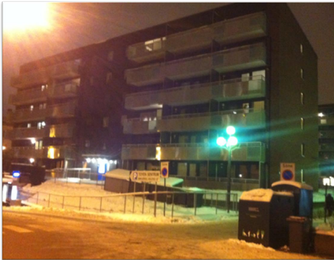
Bilde 2: Fasade og inngangsparti Hagegata 31.