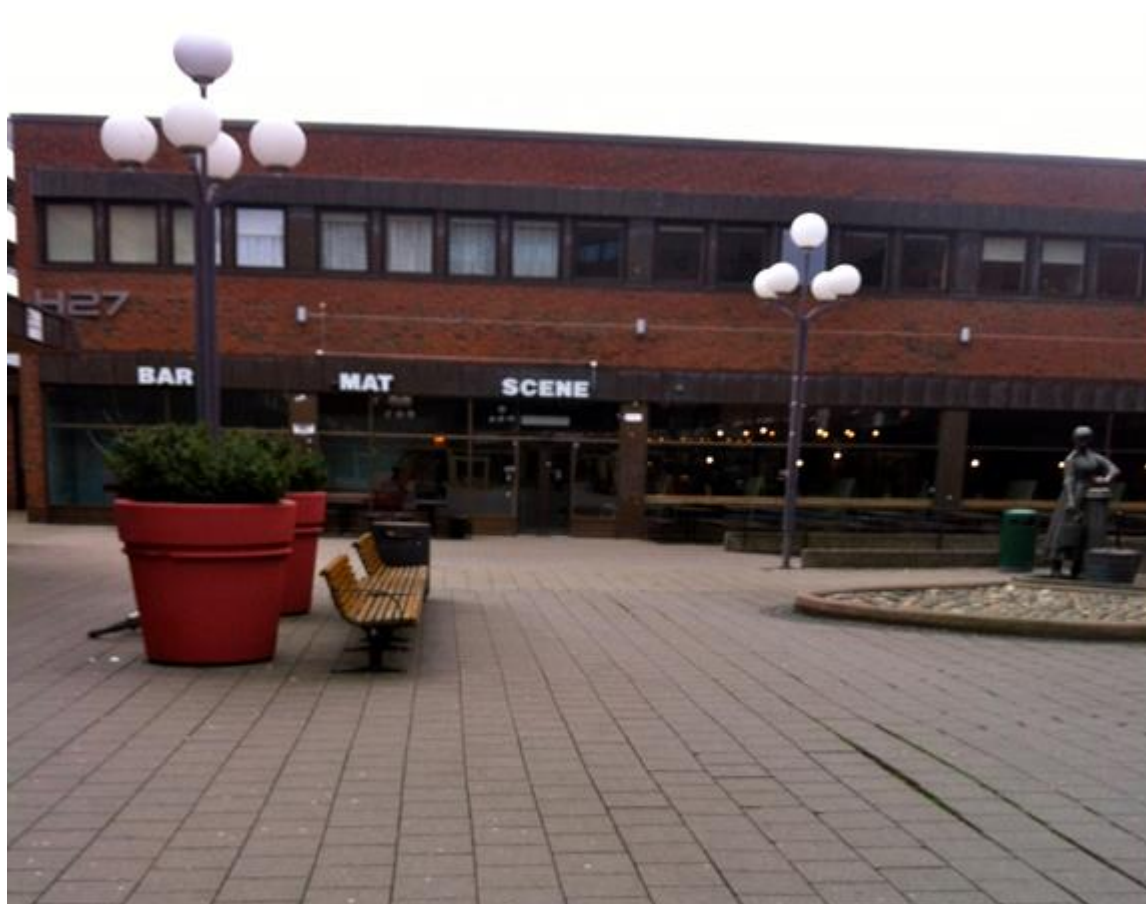
Bilde 4: Det gamle postkontoret, sett fra Tøyen torg, har gjenoppstått som Postkontoret - bar, mat og scene.