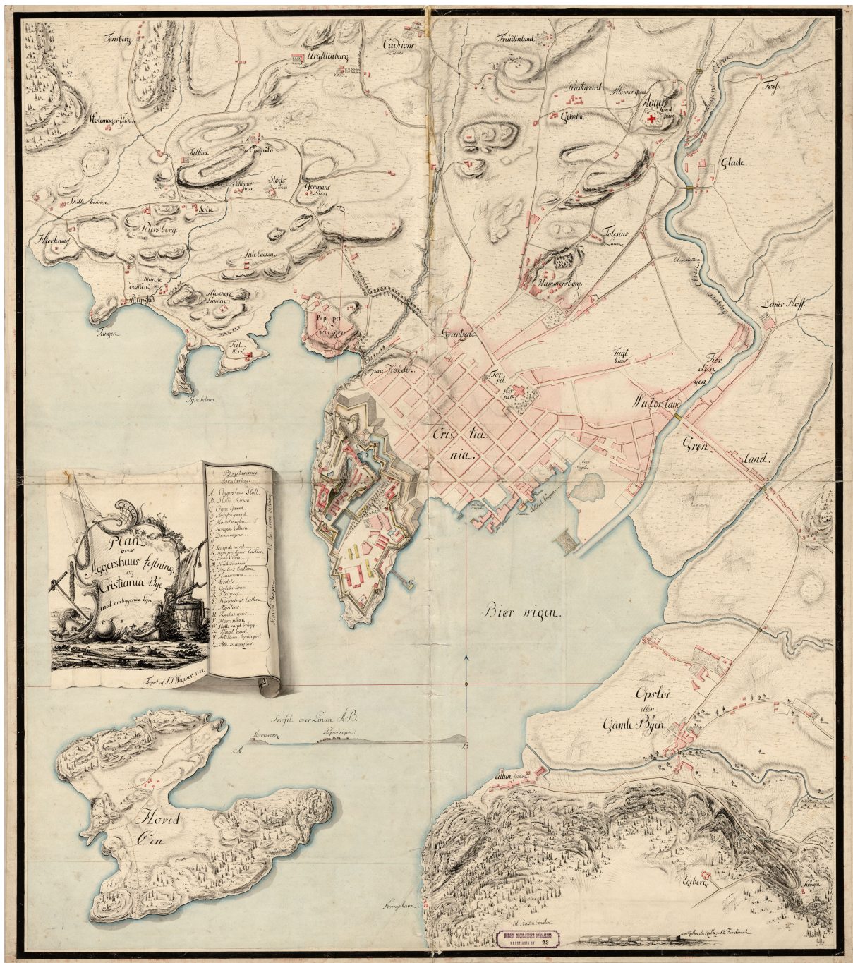
Kartet viser Akershus festning, Christiania og forstedene i 1774. Tegnet av I. T Wegner.