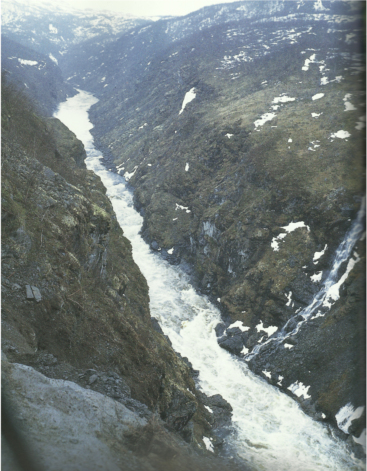
Damstedet ved Altaelven før byggearbeidene tok til 1. juni 1983.