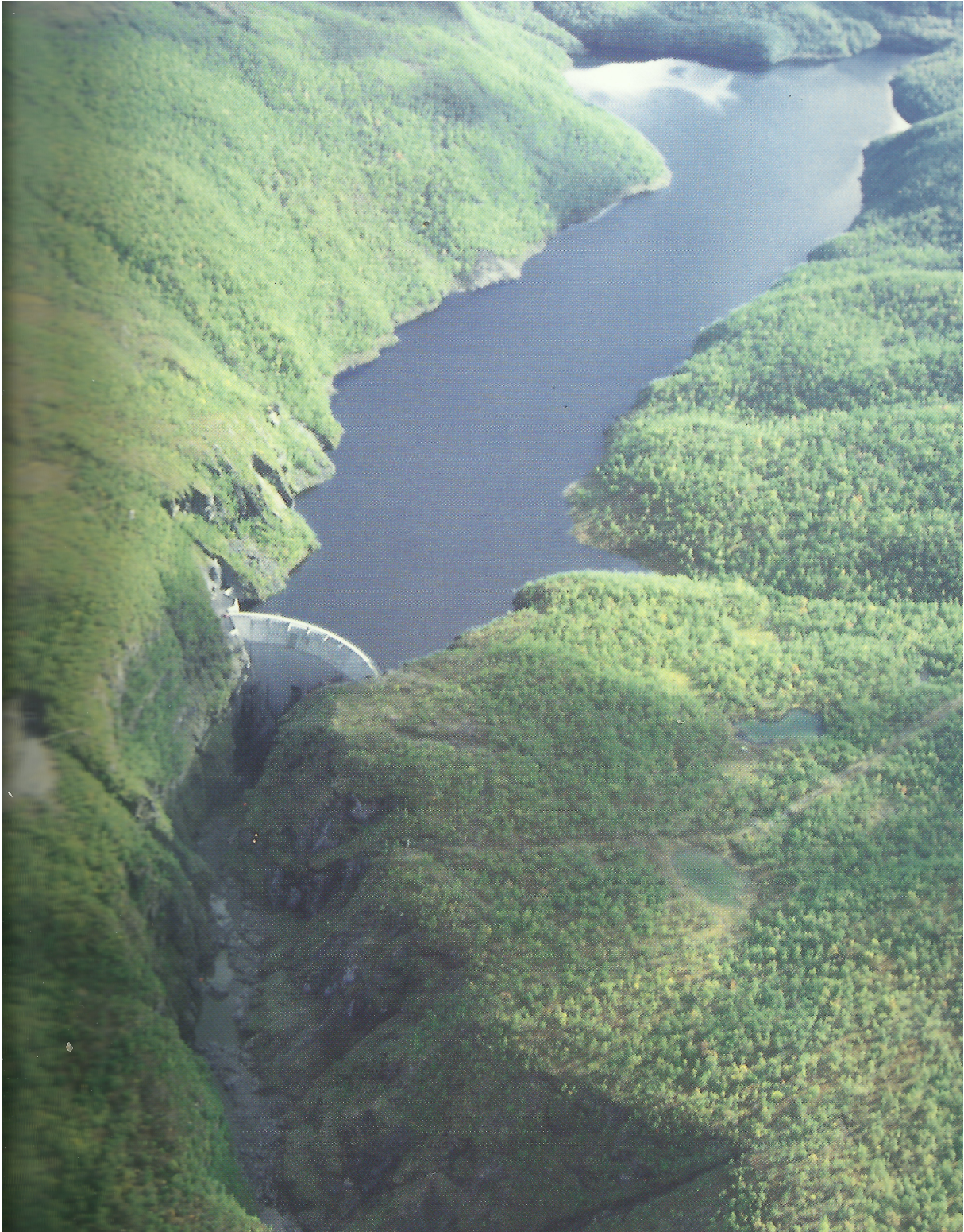
Dammen ved Altaelven med fullt magasin 4. september 1987. Kilde: Hillstad, Knut Ove 1993. Alta kraftverk i landskapet , i Kraft og miljø NR.20. Oslo: NVE, 29.