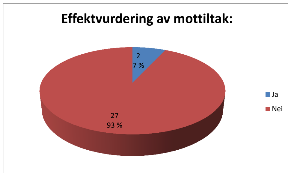
Figur 3: Effektvurdering

Ønsker myndigheter og beslutningstakere å understøtte evidensbasert kunnskapsdannelse, kan tabellen under vise et av de sterkeste uttrykkene for hva man kan investere i for å skaffe seg kunnskap om «effektive tiltak som virker». Det kan lønne seg å investere i forskningsbidrag som benytter egen empiri, rigorøs metodebruk, og særskilt undersøkelser som har en kontrollgruppe for å sammenlikne sine funn, eller vurdere effekten av de foreslåtte tiltakene. Slike «clusters of excellence» eller lommer av fremragende radikaliseringsforskning kan videreutvikles.