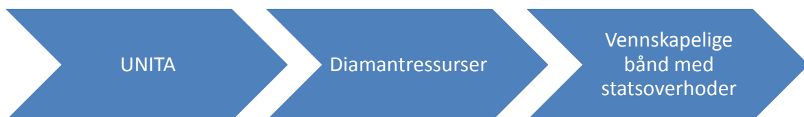
Figur 6: Fra politisk aktør til kommersiell partner: UNITA

Savimbi så på sine allianser med de afrikanske statsoverhoder (med unntak av Burkina Faso) som rene kommersielle allianser. Visse tjenester ble etterspurt, som i gjengjeld ble betalt med penger eller diamanter (ibid).