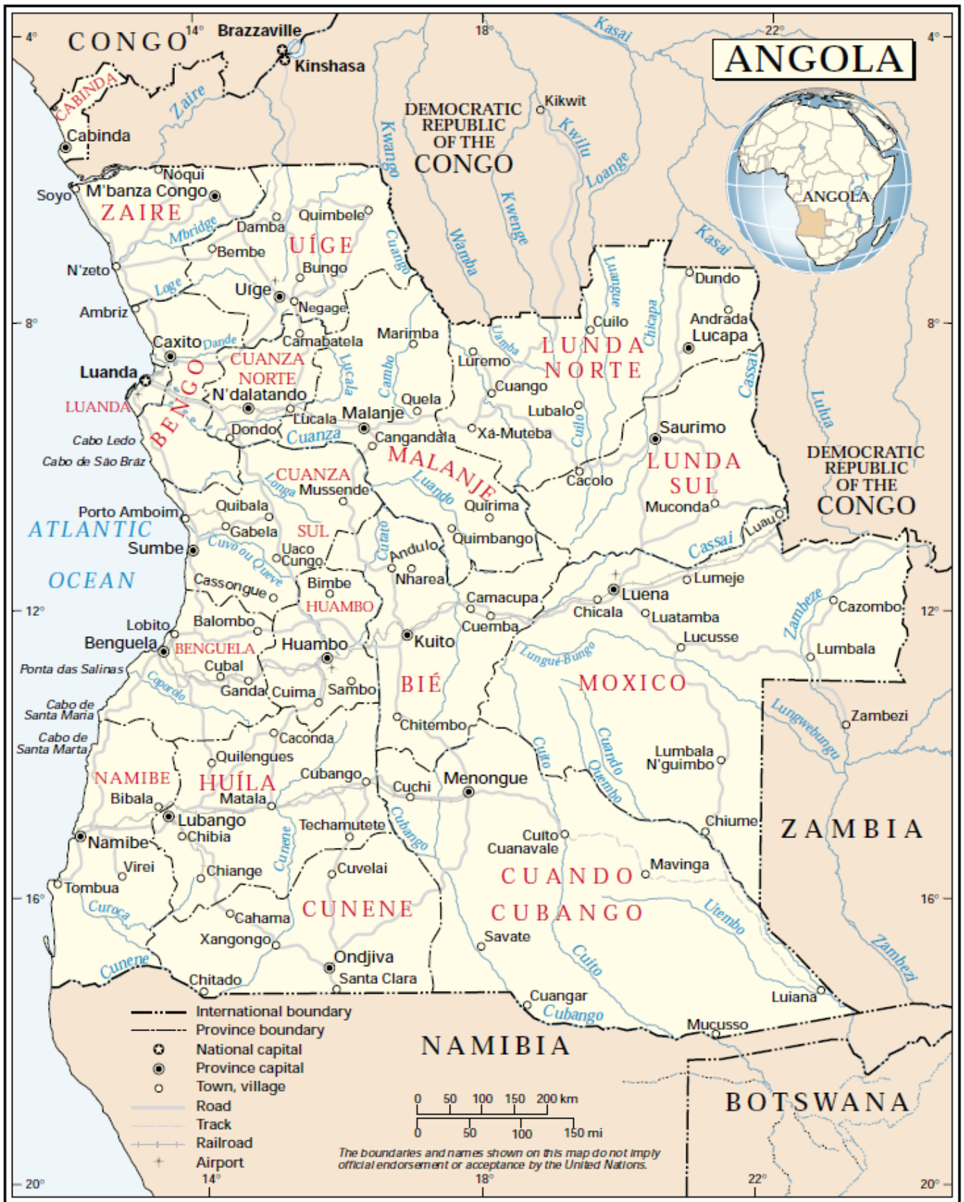
Figur 1: Kart over Angola