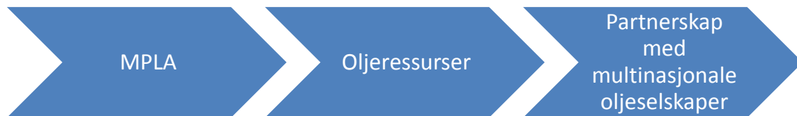
Figur 5: Fra politisk aktør til kommersiell partner: MPLA

oljeselskapene. På denne måten kunne MPLA opprettholde sin stilling både som politisk aktør, og som kommersiell partner.