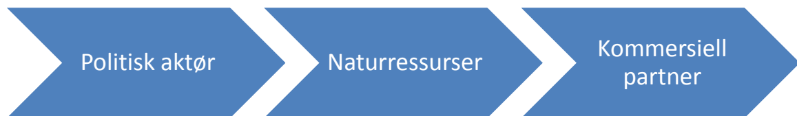
Figur 4: Fra politisk aktør til kommersiell partner

samme måte var de kommersielle aktørene avhengig av å drive handel med MPLA og UNITA, for å sikre økonomisk vekst.