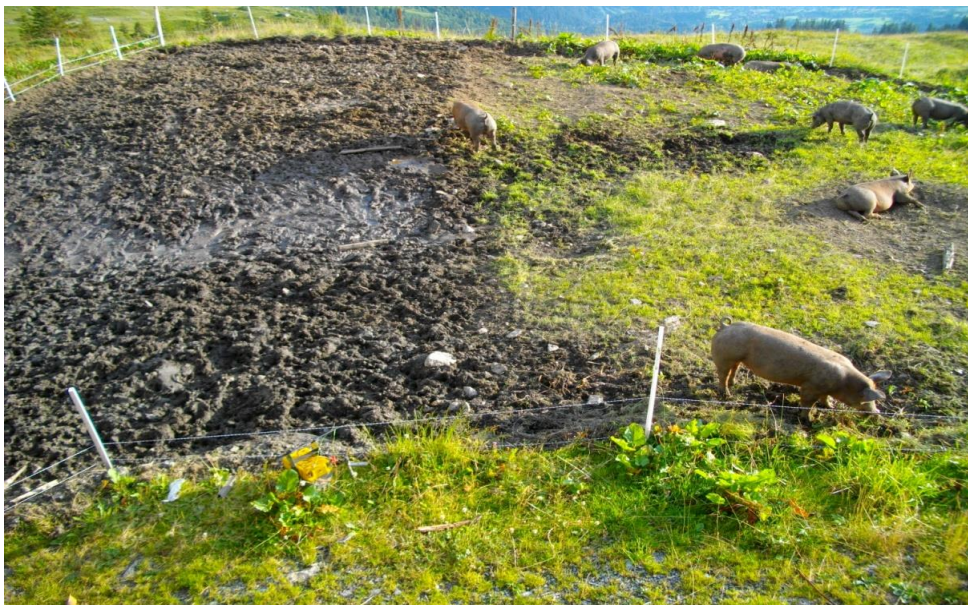
Innhengninga til grisene. Området til venstre har grisene vore på i tre-fire veker, området til høgre eit par dagar.

Trynering er ein stålring som vert sett inn mellom nasebora til grisene, og som har som hensikt å hindre grisene frå å grave i jorda. I 2008 vart eit lovforbod mot tryneringer på griser innført i Sveits. På setrene gjekk grisene tidlegare fritt. Etter forbodet vart grisene innesperra i innhegningar med straumgjerde, då dei elles ville ha greve i jorda og soleis grav opp jordsgrunnet på beitemene. Organisasjonen Sveitsisk Dyrevern ( Schweizer Tierschutz ) skriv i ein pamflett at "mikroskopiske undersøkingar visar at tryneskive òg i øvre del, der klammer vert sett inn, er sterkt innervert (forbunde til sentralnervesystemet) og difor smerteømfintleg" (Götz utan årstal). Trynet på grisen er altså ifølgje denne pamfletten ømfintleg, og det gjer dimed vondt for grisen å få sett inn nasering. Ifølgje dyrevernsforskriftene skal alle former for unødvendig påført smerte for dyr verte unngått. Ein annan viktig grunn til forbodet, var at griser bruker omlag ein femtedel av dagen på graving i jorda. Tryneringen, som var brukt nett for å hindre grisene i dette, var difor ikkje artsriktig dyrehald (BSE 2013).