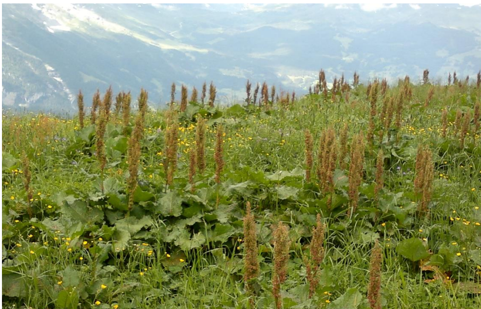
Høymol utanfor ei av hyttene på setra.