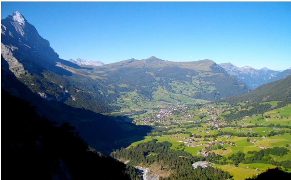
Grindelwald sett frå aust. Fjellet Eiger sjåast sør for Grindelwald. Dalen Lütschental går ut av biletet mot vest.

Femte kapittel undersøker moralitetar i forbindelse med kjeppbruk, samt ulike arenaer for sosial kontroll. Både kyr, kjeppen og bønder eller senner spelar ei viktig rolle i desse praksisane. Vidare vert ei moralsk ambivalent hending som innebar kjeppbruk analysert med hjelp av tema teke opp så langt i oppgåva. Korleis kan moralitetar påverke praksis, og omvendt? Korleis forhold bøndene seg til moralsk ambivalente situasjonar? Kva rolle spelar sosiale arenaer der bøndene og kyra opptre ilag? Kva rolle spelar setra i denne samanhengen? På kva måte er bøndenes posisjon knytt til kyra og relasjonane dei har til kyra? Dette er sentrale spørsmål som vert analysert i det siste kapittelet.