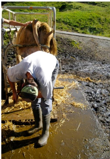
Bonde som behandlar klauvene til ei ku i ein klauvstand på setra.

skiheisen denne dagen, då hadde han tid til å sjekke dei seinare. Om føremiddagen la han eit tau rundt mulen og halsen på Adonia, leigde ho med ut mot klovbåsen, og gjekk fyrst sjølve gjennom klovbåsen slik at Adonia følgde etter. Då han kontrollerte den høgre bakklaufen fann han eit sår under han. Han behandla det, la på bandasje og etter nokre dagar byrja foten å verte betre.