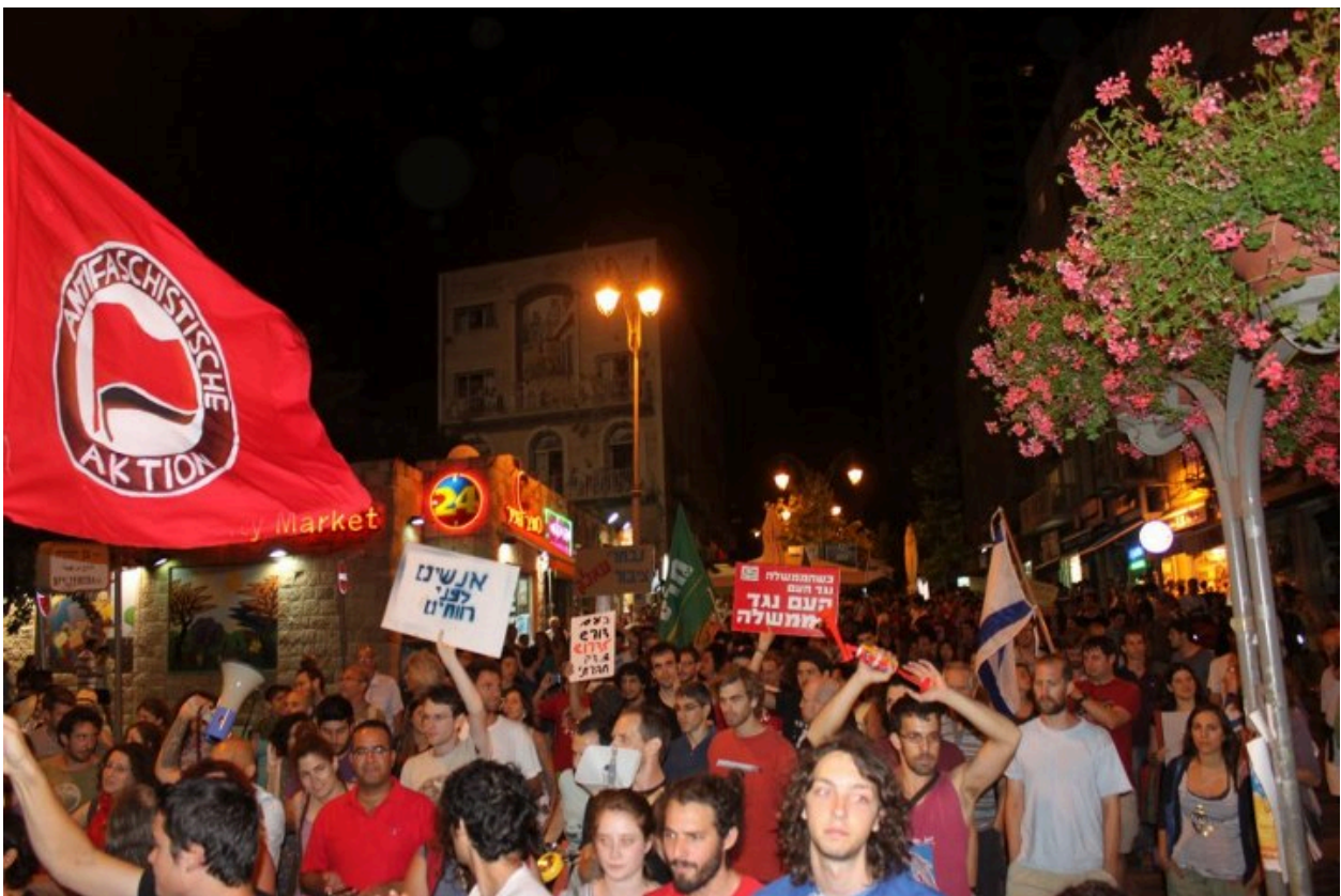
Demonstrasjon i Jerusalem våren 2012

Deltaking og forhandling av identitet i møte med den israelske fredsbevegelsen i Jerusalem