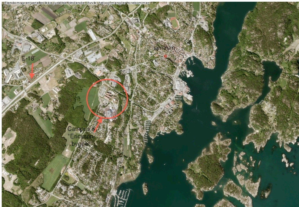
Kart 2: Kart over sentrumsområdet. Eget utsnitt og påsatte navn for å gi en grov skisse over området. Kilde: www.grimstad.kommune.no under kartdata. Målestokk: 1:14993. Besøkt 1.2.2013

Studentene dro like gjerne til Arendal eller Kristiansand for diverse aktiviteter, men byen hadde en fin natur og muligheter for sport og fritidsliv, og etter hvert også et økende kulturtilbud. Skolebyggingen har vært sentral for utviklingen av byen, og AID ble til Høyskolen i Agder (HiA) i 1994, og fikk relativt nylig universitetsstatus i 2007, som en del av Universitetet i Agder (UiA). Campusen stod ferdig i 2010, og eies av eiendomsselskapet J.B. Ugland Eiendom, som også forvalter og utvikler eiendommene i og rundt teknologiparken ved Campusområdet. Kartet under gir en grovskisse over det en kan kalle for sentrumsområdet, hvor området mellom den røde sirkelen og langs veien opp mot E-18 på den vestlige siden eies av JBU Eiendom og utvikles sammen med kommunen. Verdt å merke seg er også holmene og skjærene rundt, som gjennom et privat initiativ på 1920-tallet ble kjøpt opp av selskapet Grimstads Bys Vel, som skal sikre disse områdene for allmennhetens interesser.