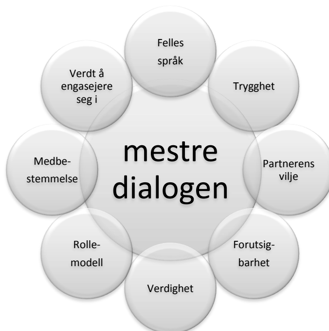
Figur 2 Hva partneren må bidra med for at en person med medfødt døvblindhet kan få bedre mulighet til å mestre dialogen.

For at partnerne skal kunne bidra til at en person med medfødt døvblindhet kan få bedre mulighet til å mestre dialogen, må partnerne benytte de ressursene Malene har tilgjengelig for å sørge for at hun får en opplevelse av sammenheng i dialogen. For å få det til må partnerne bidra til at den døvblinde personen får utvikle et felles språk med sine partnere, har partnere som har vilje til å inngå i dialogen og oppleve at dialogen er forutsigbar for at den skal bli begripelig . Videre må partneren bidra til at den døvblinde personen opplever verdighet og trygghet i sine forsøk på å mestre dialogen og at hun har partnere som kan være rollemodeller slik at hun kan få bedre mulighet til å håndtere dialogen. Partneren må også bidra til at dialogen kan bli meningsfull ved at den døvblinde personen får mulighet til medbestemmelse og ved at dialogen føles verdt å engasjere seg i . Konklusjonen er skissert i figur 2: