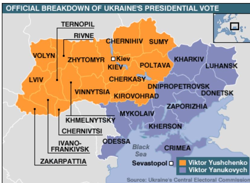
Kartet viser Ukrainas fylkesinndeling og hvordan landet var delt i to mellom øst og vest i stemmegivningen ved presidentvalget i 2004.

Skillet mellom øst og vest merkbart ved stemmegivningen, og viser sånn sett at landet er delt nesten i to ved valg. Konflikten er først og fremst identitetsmessig, med andre ord er det uenighet mellom dem som er mer russiskvennlige i øst og dem som er mer vestligvennlige og nasjonalistiske i vest. Når det kom til stykket gjenspeilte denne uenigheten seg ved stemmegivningen, så selv om kanskje oligarkene prøvde å få folk til å stemme Janukovitsj og middelklassen prøvde å få folk til å stemme Jusjtsjenko, så endte det opp med at langt de fleste stemte slik de uansett pleide å gjøre, nemlig i øst for russiskvennlige kandidater og i vest for vestligvennlige og mer ukrainsknasjonalistiske politikere.