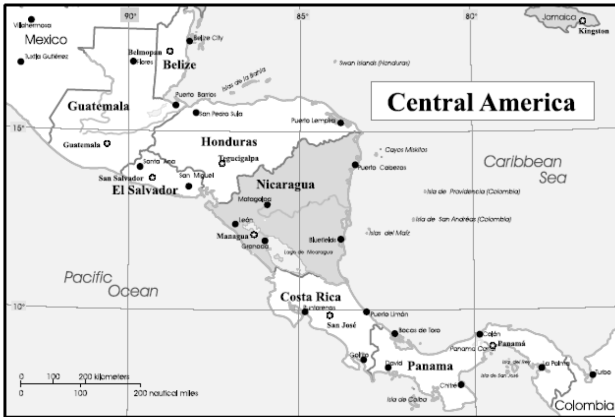
Kart 1.1 Mellom-Amerika