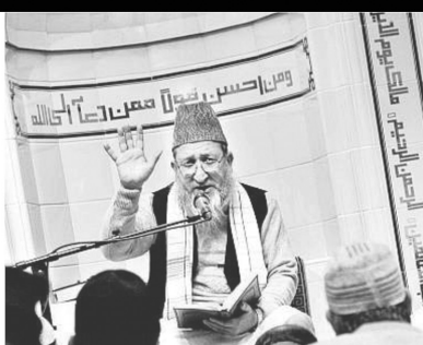
– Mediene hauser dette opp

Endringer etter etablering av moskeer i Oslo, med vekt på årene 1988, 1998 og 2008