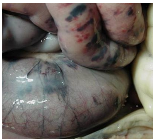
Figur 2 10 . Deler av tarm rammet av NEC. Det ses flekkvise områder med nekrose.