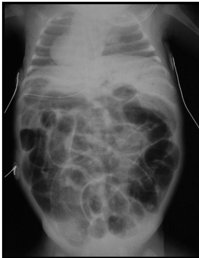
Figur 1 9 . Pneumatosis intestinalis ved NEC.

medisinsk behandlet. De finner i denne studien at generelt er barna med NEC stadium II eller høyere mer utsatt for slike utviklingsforstyrrelser, og at risikoen er økt ved kirurgisk behandling.