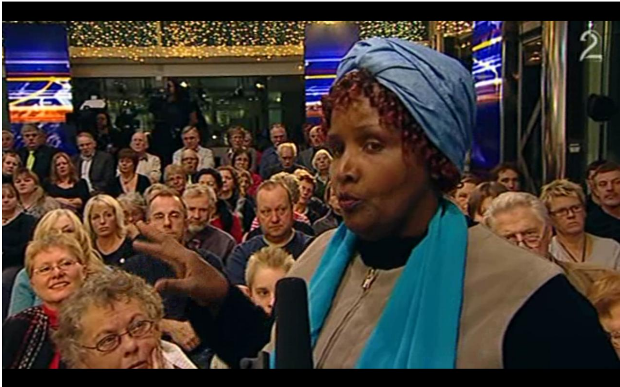
Publikumsdeltaker på Nordby Shoppingsenter på Svinesund, 26.11.08