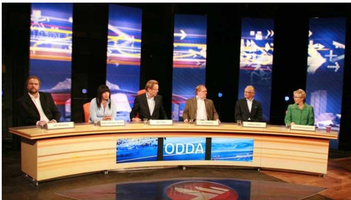
Paneldeltakere og kulisser i Odda 23.04.08, Landstingets 2. program

Landstinget foregikk som regel innendørs, med unntak av innspillingen fra Lofoten, som fant sted på hurtigrutekaia på Stamsund. Lokale kulturhus eller andre rom av en viss størrelse er typiske steder. Stedet har gjerne en scene hvor programleder og panel kan sitte, men dette er ingen nødvendighet. Kulissene er de samme i hver sending, fordi det er meningen at tv-seerne umiddelbart skal kjenne igjen programmet. Det er det samme langbordet som paneldeltakerne sitter bak, og det er de samme stolene de sitter på i alle programmene. Landstinget har også med seg bakgrunnskulisser. Under er et bilde hentet fra TV 2s nettsider fra da Landstinget besøkte Odda. Bildet illustrerer et typisk oppsett av Landstingets faste kulisser.