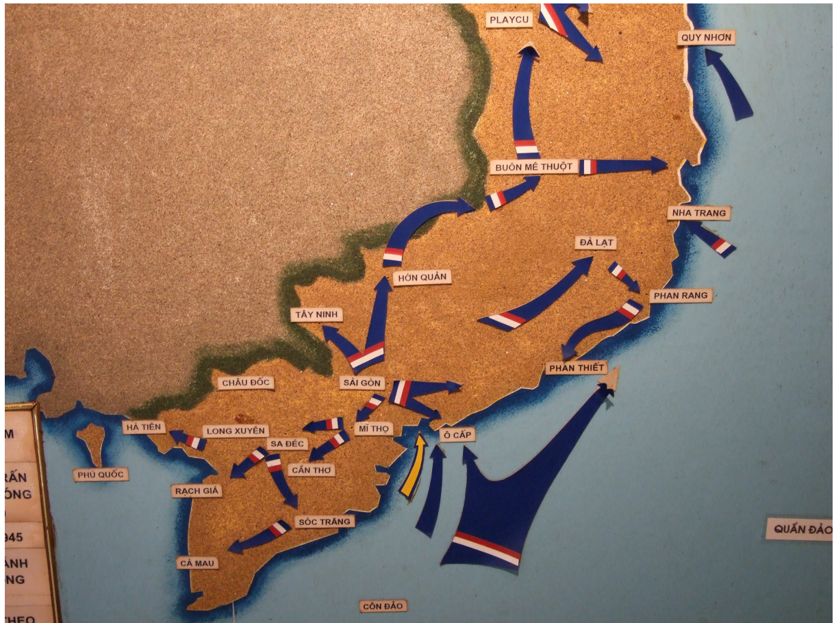
L'offensive française et britannique à l'automne 1945 présentée au Musée militaire à Hanoi (même photo que la précédente).