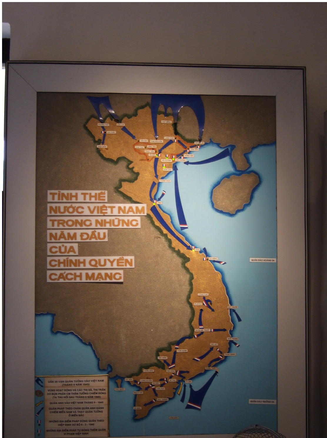
Carte de la situation au Vietnam les premières années après la Révolution vietnamienne présentée au Musée militaire à Hanoi.