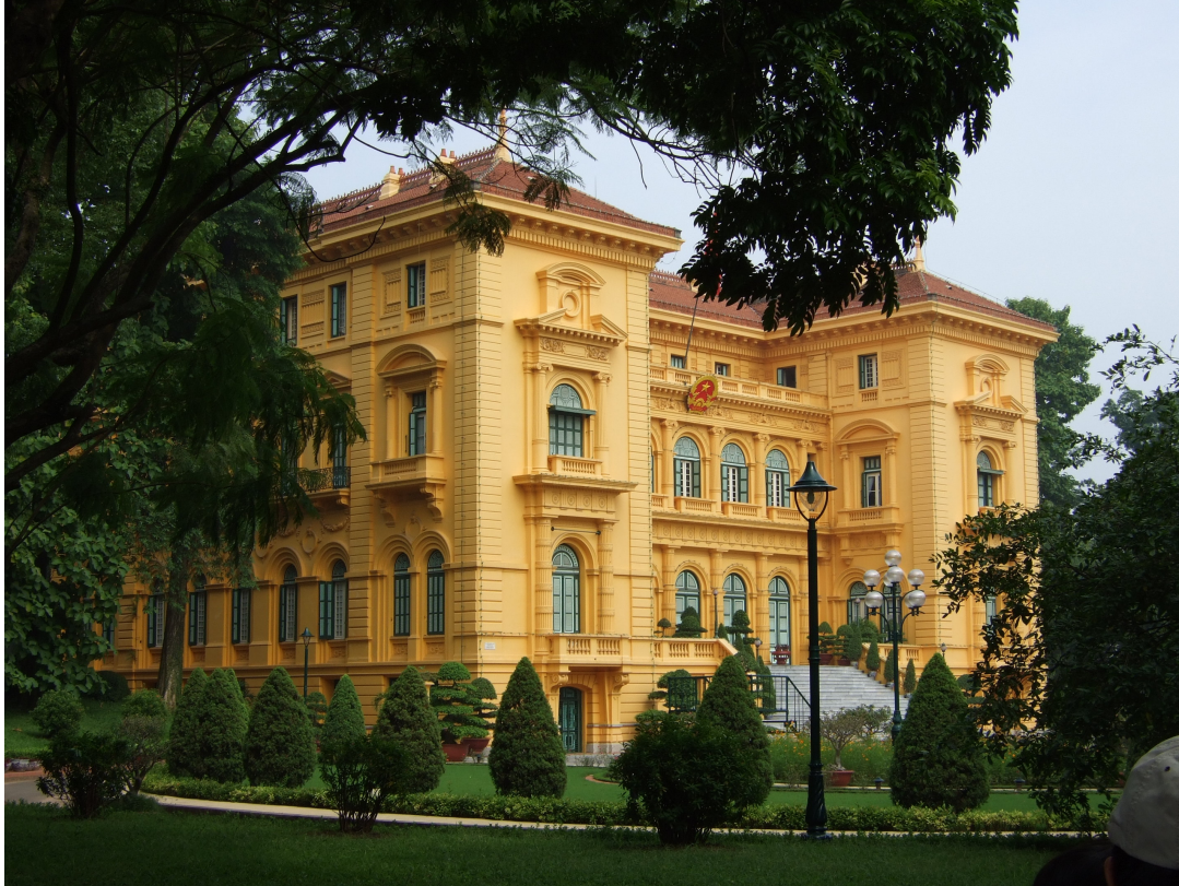
Le palais du gouverneur général français à Hanoi.