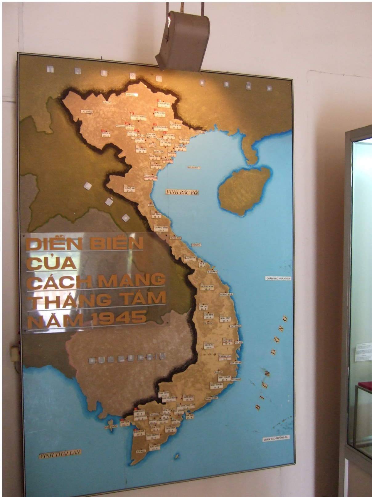
Carte de la situation au Vietnam en août 1945 au Musée militaire à Hanoi.