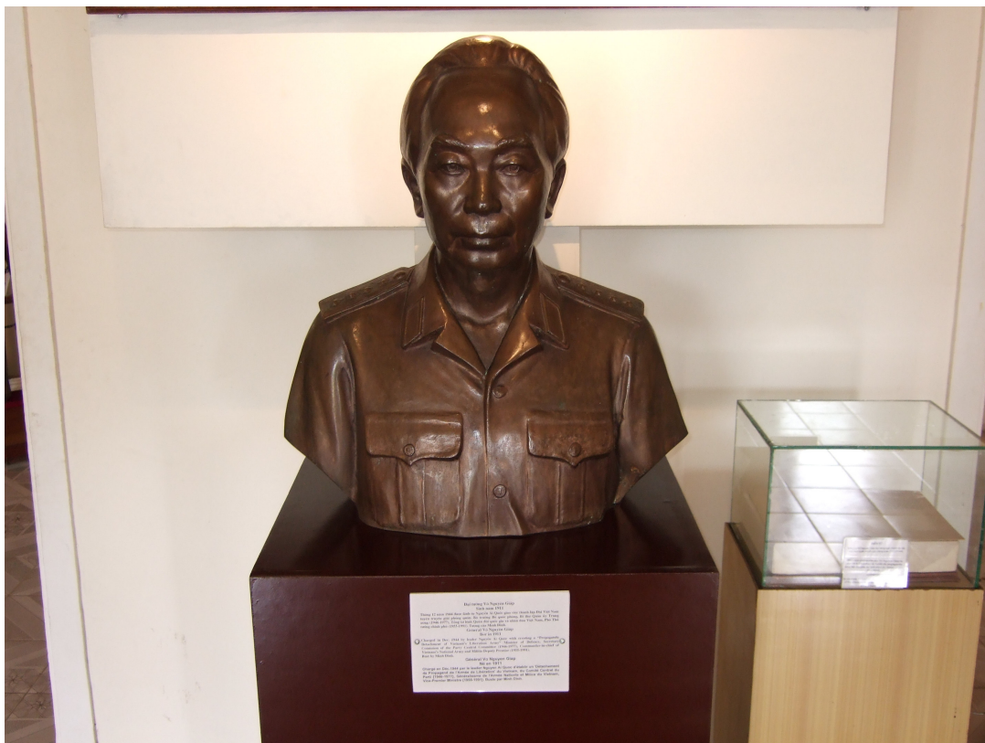
Buste du général Giap, le chef militaire du Vietminh, au Musée militaire à Hanoi.