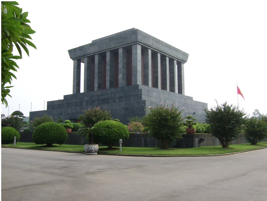
Le mausolée Ho Chi Minh à Hanoi.