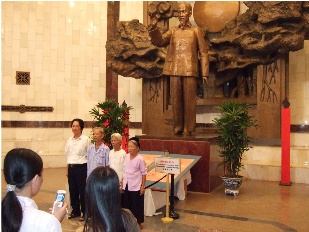
Statue de Ho Chi Minh au musée Ho Chi Minh à Hanoi.