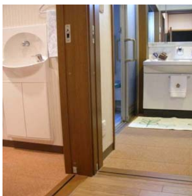
Skyvedører med ingen terskler