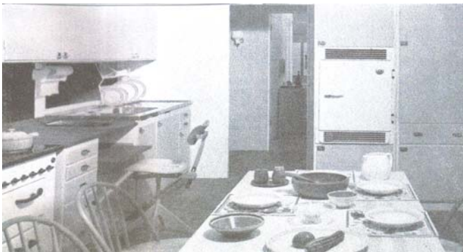
Kjøkken fra 1920-årene

Universell utforming er et forholdsvis nytt begrep for folk flest. Begrepet har eksistert i noen år nå, men som kommunalminister Magnhild Meltveit Kleppa uttalte på NRK-radio 03.12.07, så er det ikke gjort nok. Kjøkkenløsningene og samlebandstenkningen fra 1930-tallet var nye i sin tid, men er for oss i dag en del av folks hverdagsliv. Funksjonalismen tok gradvis form i befolkningens bevissthet gjennom handlingsplaner og opplysning. Fordi universell utforming kanskje ikke er så innarbeidet ennå, står myndighetene overfor en universell utfordring i fremtiden!