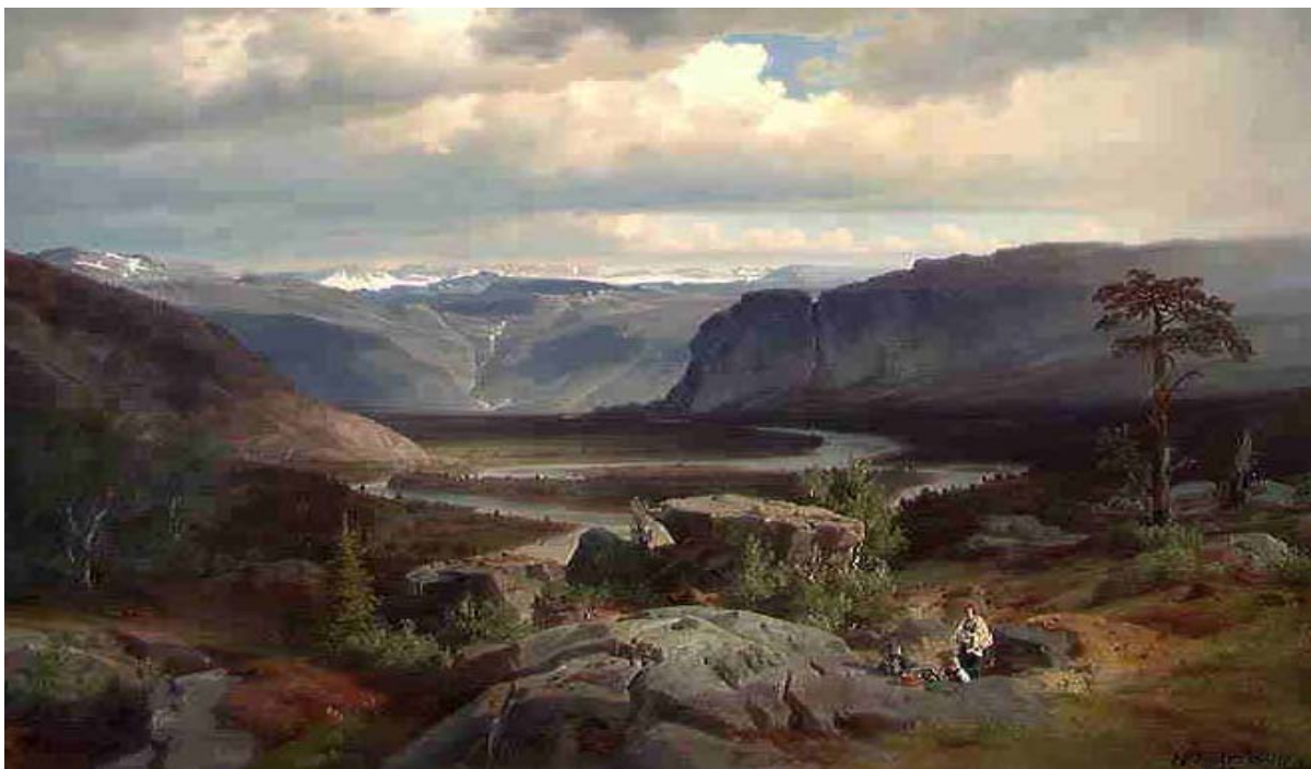
Utsnitt av J.F. Eckersbergs maleri "Fra Valle i Setesdal" fra 1852. (Nasjonalgalleriet)

Den selveiende bonden stod sterkt i Setesdal. På midten av 1700-tallet eide to av tre bønder i det som i dag er Valle kommune selv den jorda de brukte, og 93 % av jorda var i bondeie. 22 Husmannsgruppa var fremdeles relativt lita på 1700-tallet, og vilkårene deres ser generelt ut til å ha vært ganske gode: Livstidsfeste var vanlig, den årlige avgifta var lav, husmannen eide ofte sine egne hus og han hadde sjeldent arbeidsplikt. 23 Fra begynnelsen av 1800-tallet sank mortaliteten, og kombinert med økt natalitet som følge av lavere giftermålsalder for kvinnene førte dette til befolkningsvekst og økt press på ressursene. 24 Leonhard Jansen finner at det i 1786 var 19 husmannsplasser i Valle og Hylestad sogn. I 1801 var antallet økt til 35, i 1825 var det 72 plasser. 25 Samtidig skriver Jansen at "sosial klassesdeling var noko som meir hørde tida etter 1865 til. Dei skilje som hadde oppstade før, var fyrst og fremst av økonomisk art." 26