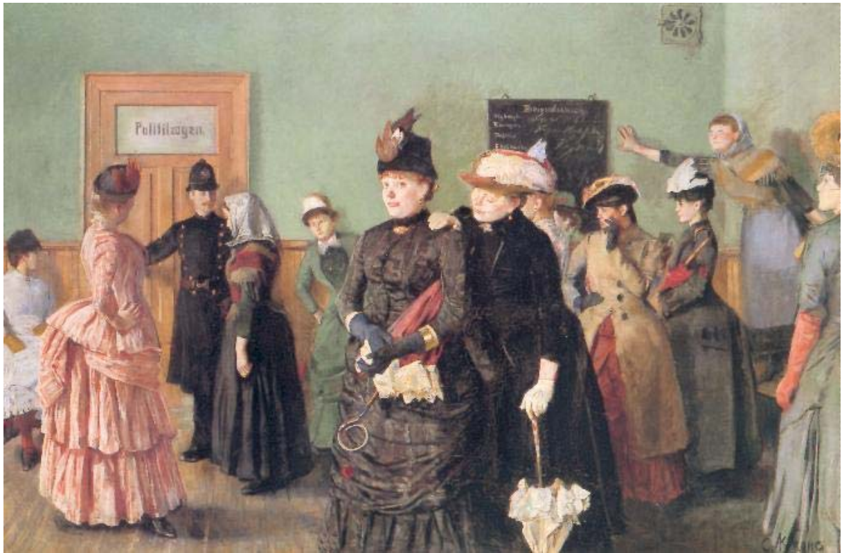
Albertine på Politilegens venteværelse, Chr. Krogh 1886